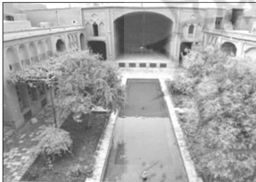
تصویر ۵: منظر دل انگیز و روح افزای حیاط در همراهی آب با گیاه و معماری

به طور کلی حوض در حیاط به دلیل تلطیف هوا، محلی برای وضو، همچنین شستشو و ذخیره آب برای آبیاری باغچه ها در نظر گرفته می شد. در فرهنگ اسلامی حضور آب در حوض و در دل حیاط، به عنوان نماد زندگی، بهشت، پاکی و نشانه زیبایی و آبادانی است و آب گذشته از جنبه مصرفی آن، بیشتر به دلیل جنبه های نمادین آن، مورد استفاده قرار گرفته است. حوض آب، نماد بهشت و زندگانی است. تعالیم اسلامی آب را به صفت طهور (پاک و پاک کننده) و مبارک و خجسته توصیف می نماید؛ که در قرآن با آیات و انزلنا من السماء ماء مبارکاً؛ از آسمان، آبی خجسته و مایه برکت نازل کردیم (ق، ۹) بیان شده است.