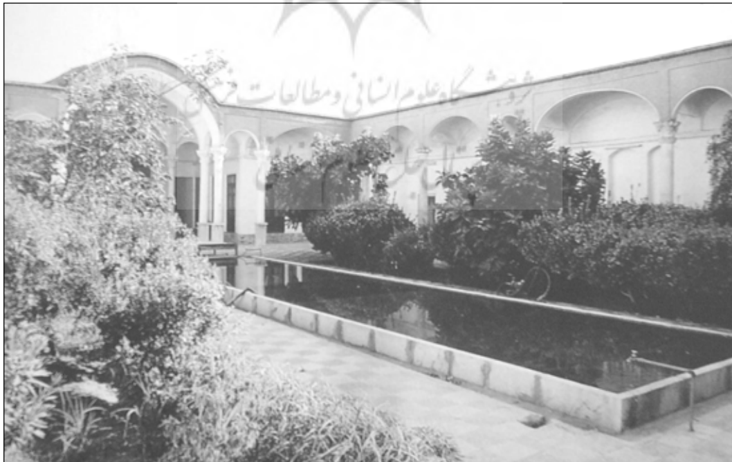
تصویر ۱: جایگاه استقرار حوض آب در حیاط خانه سنتی ایران

هر بنایی به عنوانی جزئی از فرهنگ، وظیفه دارد که یک اندیشه ذهنی را از طریق فرم، عینیت بخشد و این عینیت حامل پیامی تحت عنوان "هویت" مطرح می شود. معمار سنتی در جستجوی نظمی بر اساس بهره وری از مواهب طبیعی و هماهنگی با نظم حاکم بر طبیعت بوده؛ به دنبال آماده سازی مکانی است که هر آنچه از مواهب طبیعی است، در محدوده زیست فراهم آورد؛ بدون آنکه خلوت زندگی به هم بخورد. در پاسخ به این خواست، خصوصی ترین باغ درونی را می سازد و آن را با نام حیاط معرفی می کند. حالت بلورین و طرح منظم هندسی فضاها در خانه سنتی و ساختار هندسی این واحدهای بلورین برگرد حیاط، بر اساس ملاحظات محیط زیست و رعایت عرصه های عمومی تا خصوصی است که کل خانه را می سازد.