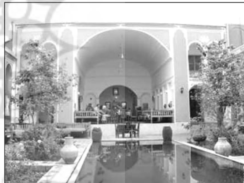
تصویر ۴: تدوین فضای قرار در حیاط خانه سنتی با استفاده از عنصر آب

در اسلام آب زمینه ساز ارتباط با معبود بوده و شرط دخول در بسیاری از عبادات، وضو داشتن است. انجام آیین وضو، به معنای یکی دانستن خود، در دنیای مادی، با موج رحمت خدا و بازگشت به همراه آن به سوی اصل و مبدأ است. (لینگز، ۱۳۷۴: ۶۰۵). حضور آب در حوض حیاط های خانه سنتی، فرصت مناسبی را جهت انجام مقدمات فرائض دینی فراهم می آورد.