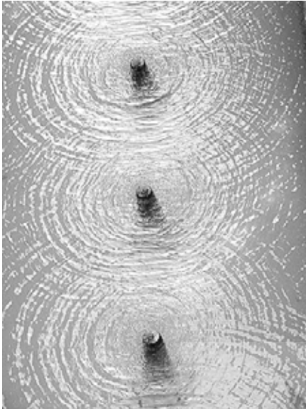
تصویر ۶: منظر، ترنم، خنکی و احساس با بهره گیری از عنصر آب در حیاط خانه سنتی ایرانی

از سر و کول هم بالا می روند (نایی، ۱۳۸۱: ۹) و چنانکه در کتاب حس وحدت می خوانیم: "افاضه فواره- زاینده ی دواير آب با شعاع های دم افزون- آغازگر دوباره ی تناوب بسط و قبضی آگاهانه است." (اردلان و بختیار، ۱۳۸۰: ۶۸)