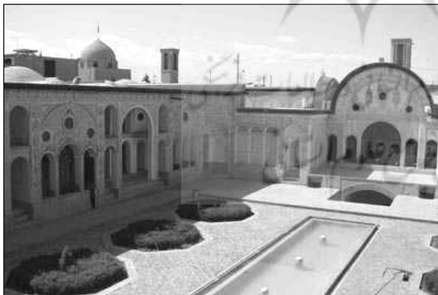
تصویر ۳: تشدید اهمیت مرکزگرایی در معماری سنتی ایران با قرار دادن عنصر ارزشمند آب

وجود حوض در مرکز حیاط، اشاره بر اهمیت و مرکزیت آب در هستی دارد. حیاط مظهري از صورت مرکزگرای عالم صغیر یا باطن است. فضا در حد مکان "کنز مخفی" خانه در شکل محاط شده است، همچنان که در انسان نیز نفس که دربرگیرنده روح است، در جسم محاط می شود. میانکش شکل و سطح باید فضایی پاک، غرق آرامش و خالی از هر تنش و تفکر انگیز باشد. تعبیه حوض سنتی در این فضای آرام، مرکزی را همچون جهتی مثبت برای تخیل خلاقه فراهم می آورد. بدینسان آفرینش عرضی آدمی به علت طولیه می پیوندد و بازسازی بهشت تمامی می پذیرد. (اردلان و بختیار، ۱۳۸۰: ۶۸) تصور بهشت موعود که از ادوار قبل تا کنون در مخیله ایرانیان به وجود آمده، تصویری است از زیباترین و دلپذیرترین باغ ها. (ویلبر، ۱۳۴۸: ۵۲) حیاط ها نماد و تمثیلی از بهشت هستند که در خانه های ایرانی، جلوه خاص خود را داشته اند. به تعبیر بورکهارت، طبیعت بهشت ایجاب می کند که مستور و راز آلود باشد؛ به همین ترتیب خانه مسلمان با حیاط مرکزی محصور شده به همراه درختان و آب، مشابه این جهان معنوی است. (نقی زاده، ۱۳۴۸: ۲۲۲) همچنین آیات بسیاری در قرآن به کرات آب را به عنوان یکی از عناصر بهشت معرفی می نماید. ۴