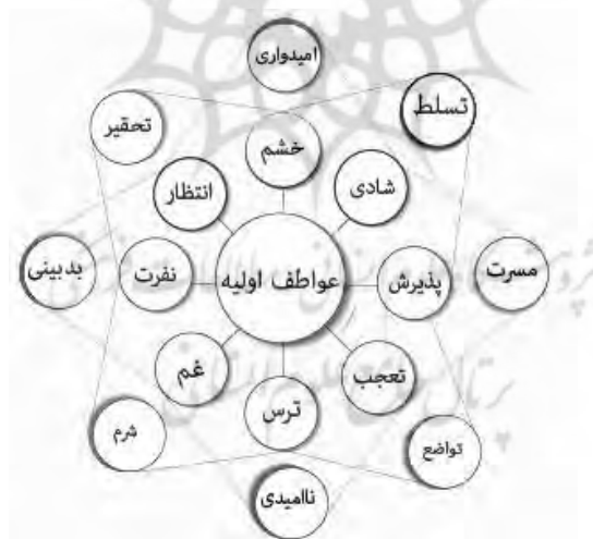
شکل شماره (۳) عواطف ترکیبی دوتایی نوع دوم

به همین ترتیب هشت عاطفه اولیه قابلیت ترکیب نوع دوم، یعنی یک در میان را هم دارند. اگر عواطف به صورت یک در میان با هم ترکیب شوند، نتیجه را یک ترکیب دوتایی نوع دوم نامند: