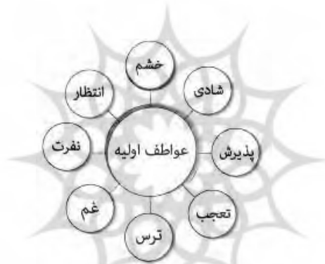
شکل شماره (۱) عواطف اولیه

سازگاری و انطباق بیولوژیکی هستند، شرح می‌دهد که این ابعاد مختلف عبارتند از: بعد تخریب، دفاع، جذب، دفع، تولید مثل، محرومیت، جهت‌یابی و اکتشاف. به نظر می‌رسد که این ابعاد عاطفی شامل مجموعه‌ای از محورهای دو قطبی از قبیل تخریب در مقابل دفاع، جذب در برابر دفع، تولید مثل در برابر محرومیت، جهت‌گیری در مقابل اکتشاف باشند. اگر در مورد این اصطلاحاتی که برای توصیف این عواطف اولیه در انسان به کار می‌رود، بیندیشیم، مفهوم دو قطبی بودن آن‌ها برای ما روشن‌تر خواهد شد. در نظر ما شادی در برابر غم، پذیرش در مقابل تنفر، خشم در برابر ترس و تعجب در مقابل انتظار مطرح می‌شود (پلاچیک، ۱۳۷۵: ۱۲۹):