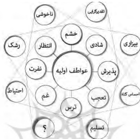
شکل شماره (۴) عواطف ترکیبی دوتایی نوع سوم

این ترکیب برای پلاچیک هم مبهم است. البته در این باره تنها اینقدر می‌توان گفت که عاطفه به دست آمده از این ترکیب هم عاطفه منفی خواهد بود: