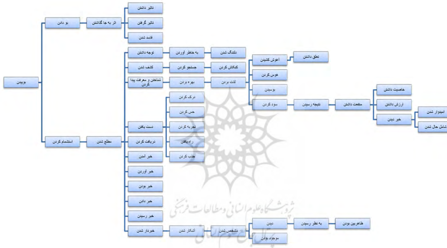
نمودار ۲: شبکه معنایی فعل «بویدن» در زبان فارسی