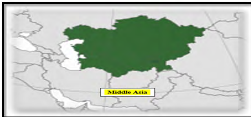
نقشه ۲: آسیای میانه ↑