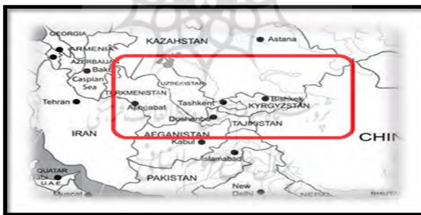
نقشه ۱: آسیای مرکزی ↑

با چنین اوصافی ترجمه این کتاب هرچند به خودی خود اقدام مفیدی است اما این که کارکرد این کتاب را یک "منبع اصلی" برای واحد درسی تاریخ اسلام در آسیای میانه در مقاطع کارشناسی و کارشناسی ارشد دانشجویان رشته تاریخ قلمداد کنیم در بهترین فرض نشانه غفلت از اقتضائات یک متن درسی در نظام آموزش عالی است. اگر "سخن ناشر" حداقل عنوان می‌کرد که این کتاب را به عنوان یک "متن جنبی و فرعی" برای دانشجویان این واحد درسی ترجمه و منتشر ساخته است قابل پذیرش بود. اما به هر حال این غفلتی است که ناشر (سمت) مرتکب شده است. این غفلت هنگامی که با دخل و تصرف در ترجمه عنوان کتاب همراه می‌شود و اصطلاح "آسیای درونی" که هدف و انگیزه نویسنده را بهتر نمایندگی می‌کند با اصطلاح "آسیای میانه" که هدف ناشر را تأمین می‌کند جایگزین می‌شود، می‌تواند شائبه اغفال را نیز به دنبال داشته باشد.