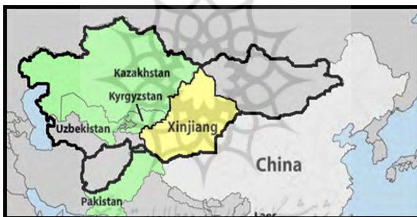
نقشه ۳: آسیای درونی ↑