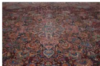
نمونه ۲۰