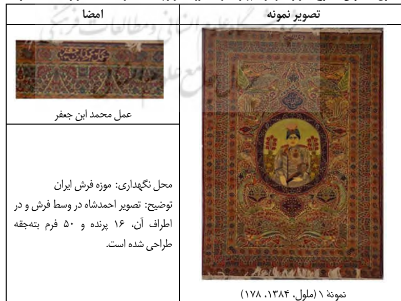
جدول ۲: فرش با طرح تصویری از گونهٔ چهره‌نگاری، گروه تصویر پادشاهان و اطلاعات مربوط به آن (نگارندگان)

در این پژوهش دو نمونه از فرش‌های ارجمند با امضای «عمل محمد ابن جعفر» آورده می‌شود که دارای طرح چهره‌گشایی در میان نقوش عصر ترمه هستند. در جداول (۲ و ۳) تصویر فرش‌های ارجمند که دارای طرح تصویری هستند و در گروه چهره‌نگاری جای می‌گیرند، آورده شده‌است.