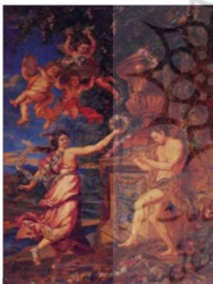
تصویر ۲: تابلوی نقاشی اروپایی (زکریایی کرمانی، شعیری و سجودی، ۱۳۹۲: ۵)