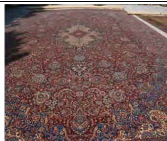
نمونه ۱۹