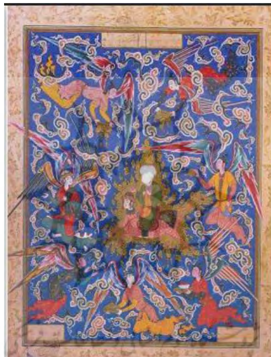
تصویر ۱. تصویر معراج پیامبر (ص). هفت اورنگ جامی. ۹۶۳ق. دوره صفوی. مکتب دوم تبریز.

عارف کسی است که در نیل به حقیقت جهان نه بر عقل و استدلال بلکه بر سیر و سلوک و دریافت و مجاهده و اشراق متکی بوده و هدفش به‌جای درک و فهم حقایق، وصول اتحاد و فنا در حقیقت است. علاقه‌مندی و تلاش عرفا برای دعوت از دوستداران حضرت حق به این بزم الهی، باعث توسل ایشان به هنرهایی چون شعر و ادبیات شده است. از این راه بود که عارفانی چون عطار نیشابوری، سعدی، حافظ و جامی، معارف و مبانی عرفان اسلامی را انتشار داده و به گوش مخاطبان نشان رسانده‌اند. این مجموعه‌های عظیم شعر عرفانی بارها مورد استقبال نگارگران قرار گرفته است و به تصویر درآمده است (بابایی فلاح، ۱۳۹۱: ۸۱۰). تصویر شماره ۱ که معراج پیامبر را به تصویر کشیده است نمونه‌ای از این مضامین عارفانه است.