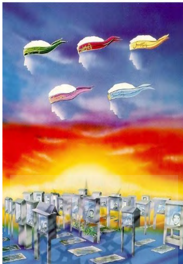
تصویر ۴. پوستر بهشت زهرا، از ابوالفضل عالی، ۱۳۶۲