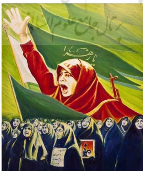
تصویر ۲. پوستر راهیان راه زینب. از محمد خزایی. ۱۳۶۲.