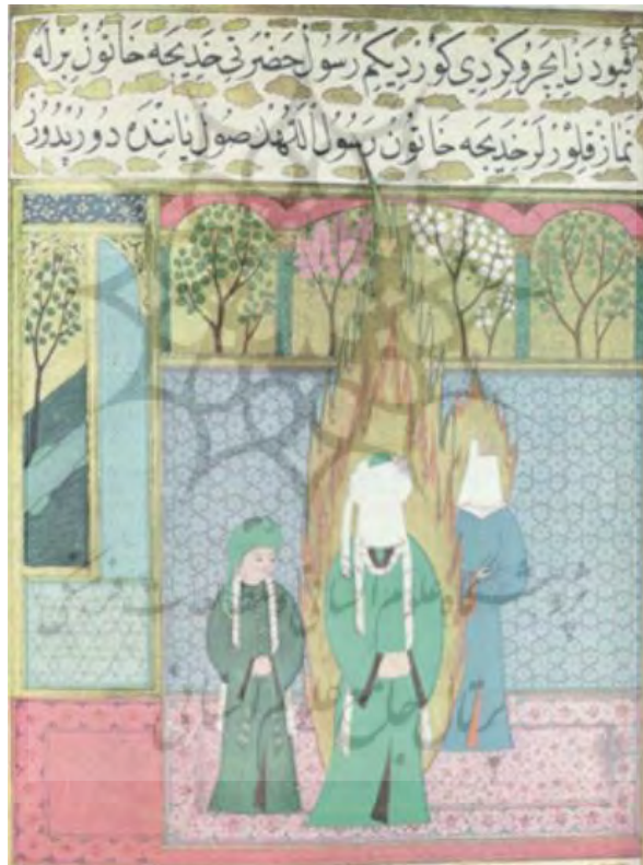
تصویر ۳. نگاره نماز پیامبر. از احمد نورین مصطفی. قرن دهم. محل نگهداری: موزه تویقایی سرای استانبول

که نماد تعصب دینی این دوره هرچند در زدایش عقاید میتراپرستی به بهانه ارتداد تا حدی موفق گردید (لوکونین، ۱۳۵۰: ۱۵۸)؛ لیکن این مبارزه دینی باعث نگرید تا مهرپرستی و رسوم دینی گذشته در دوره‌های بعد به انزوا کشیده شود بلکه آیین‌ها و رسوم قبل از زرتشت، ایزدانی همچون بهرام و مهر پس از رخوت و فترتی کوتاه ققنوس‌وار و با شمایی قابل وفق با آیین زرتشت ظاهر گردیدند. مهر در دوره ساسانی به‌عنوان یکی از پڑته‌ها به معنی پرستیدنی پس از مقام امشاسپندان قرار گرفت. هر یک از پڑته‌ها که اهورامزدا و زرتشت به ترتیب در رأس انواع آسمانی و زمینی آنان قرار دارند. موکل یکی از اجسام مانند ستارگان، زمین، مواد، آتش و آب با یکی از صفات خود مانند راستی، پیمان و توانایی مهر در این معنا مهر خداوند روشنایی و راستی است که در کنار سرئوشه (سروش) و رشنو جهان را قضاوت می‌کنند (نفیسی، ۱۳۸۴: ۷۰). در تصویر شماره ۳ کاربرد عناصر آتش برای نشان دادن تقدس پیامبر استفاده شده است.