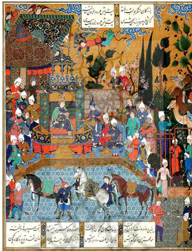
تصویر ۱: نگارهٔ دربار فریدون. شاهنامه. منسوب به قدیمی با مدیریت سلطان محمد. محل نگهداری: موزه ملی بریتانیا

در زمان هخامنشیان ایزد بانو آناهیتا با مهر بارها مورد ستایش واقع شده است. ستایش این دو ایزد در کنار اهورامزدا صورت می‌گرفت. در نیایش‌ها شاهان، مهر را به‌عنوان گواه ایمان آنان قرار می‌دادند لذا مهر در دین رسمی به مقام ارجمندی دست‌یافته و در تقویم و گاهنامه‌های رسمی نام هفتمین ماه سال را به‌خود اختصاص داده بود. در تقارن نام ماه و روز یعنی شانزدهم مهرماه روز مهر نام داشت در این روز در سراسر قلمرو هخامنشی جشنی تحت‌عنوان مهرگان که از جشن نوروز با اهمیت‌تر بود برگزار می‌شد. به هنگام مراسم جشن مهر، شاه ردای ویژه ارغوانی به تن کرده و مجاز بود در مراسم باده‌نوشی هر اندازه که بخواهد زیاده‌روی کند و در مراسم ویژه دست‌افشانی نماید (کومون، ۱۳۹۳: ۳۱-۳۰).