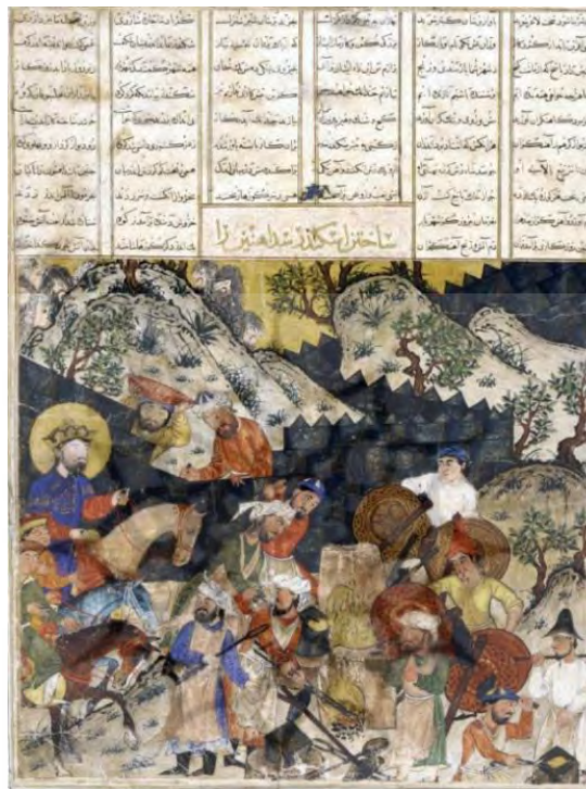
تصویر ۴: هاله نور دور سر اسکندر. برگی از شاهنامه. مکتب هرات اول. محل نگهداری: موزه اسمیت سونیان.

تلقی می‌گردد، لیکن نقش برجسته طاق‌بستان به علت قرار گرفتن ایزد مهر در کنار شاه بی‌نظیر می‌باشد. اولین کسی که برای نخستین بار به تصویر ایزد مهر در این نقش برجسته پی‌برد، فردینانت پوستی بود. وی مشابه این نقش را با همین هاله برگرد سر به روی سر سکه‌های شاهان کوشانی و کتیبه‌ای بر روی سکه‌ها به نام میترا تشخیص داده بود. تصویر ایزد مهر در نقش برجسته طاق‌بستان یگانه تصویری از این ایزد در ایران دوره ساسانی است (فرای، ۱۳۸۵: ۲۴۸-۲۴۷).