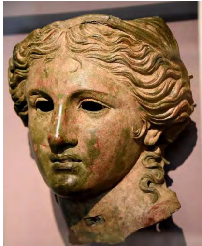
تصویر ۴. سردیس فلزی آناهیتا، مربوط به دوره باستان. محل نگهداری: موزه ملی بریتانیا

توصیف الهه ملبس به پوست حیوانات که مثل ملکه برفی در خیلی از افسانه‌ها ظاهر می‌شود به ما این اجازه را می‌دهد که بعضی چیزها را در مورد آب و هوا و محیط‌زیست طبیعی که او ابتدا در آنجا تصور می‌شده است را مجسم کنیم. بیشتر از همه به نظر می‌رسد که جایی سرد بوده است. این مطابق با توصیف اوستا از سرزمین اصلی ایرانیان است، Airyanam vaejo.