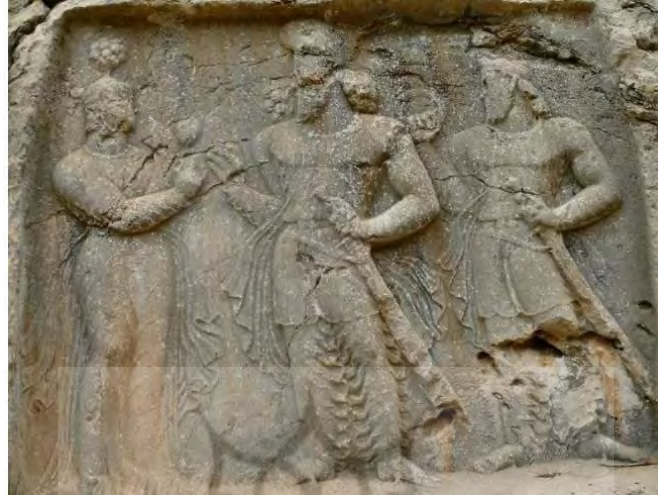
تصویر ۲: آناهیتا (الهه آب). نقش رستم. دوره ساسانی

مجسم می‌سازد. لباس او بدن او، جایگاه او، اسب او و خیلی از چیزهای دیگر مربوط به او با جزئیات تصویر شده است. این جزئیات را می‌توان در تصویر شماره ۲ که سنگ‌نگاره‌ای از دوره ساسانی است مشاهده کرد.