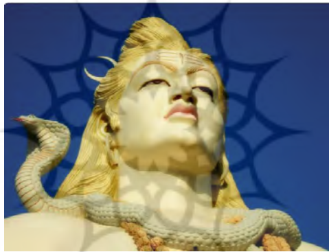
تصویر ۱. مجسه شاکتی، خدای نابودگر. دهلی، هند.

بعضی اوپنیشدهای متأخر که به شکتی پرستی گرایش دارند و نیز شماری از تنترها شکتی را برابر با برهمن گرفته‌اند. در این متون، طبیعت فراگیر برهمن و شکتی، ماده اولیه و زیربنایی در کل وجوداند و آن‌ها را نمی‌توان از هم جدا انگاشت. شکتی نه فقط با برهمن یکی است، بلکه با طبیعت و ماده (پرکریتی) نیز وحدت دارد. اوپنیشدها و تنترها مزبور به ذات مستقل و قادر مطلق شکتی اشاره دارند که در آن‌ها کیفیات مکمل و پذیرنده نیروی مذکر (همچون شیوه) در برابر قدرت فعال آن بیکار و عاجز است. هنگام آفرینش نخستین امری که رخ می‌دهد ظهور "قدرت" (شکتی) است که زمانی بس طولانی در اعماق هستی الهی نهفته است. این "قدرت" به وسیله اراده مشخص می‌شود که نخستین واقعیت حادث شده در آن است (همان: ۴۳۲ و ۴۳۳). تصویر شماره ۱ یکی از نمادهای خدای شاکتی در هند می‌باشد.