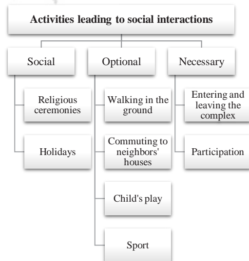
Fig. 2. Activities leading to social interactions

روش تحقیق توصیفی-تحلیلی است و از حیث رویکرد، کیفی می‌باشد. برای جمع‌آوری اطلاعات از روش کتابخانه‌ای و میدانی استفاده شده است. با توجه به هدف این پژوهش، که سنجش و مقایسه شیوه تعاملات اجتماعی در دو گونه مختلف مجموعه‌های مسکونی است؛ مطالعات و بررسی‌های مورد نظر به شناخت عوامل و فعالیت‌هایی که منجر به تعاملات اجتماعی می‌شوند، می‌پردازد. در این راستا، در قدم اول با انجام مطالعات کتابخانه‌ای و بررسی پژوهش‌های از پیش انجام‌شده، فعالیت‌هایی که منجر به شکل‌گیری تعامل اجتماعی در بین افراد می‌شود، بر اساس نظریه یان‌گل در سه دسته فعالیت‌های ضروری، فعالیت‌های انتخابی و فعالیت‌های اجتماعی دسته‌بندی شده است. سپس فعالیت‌های قابل انجام در مجموعه‌های مسکونی که در هر یک از این دسته‌ها جای می‌گیرند استخراج شد (شکل ۲).