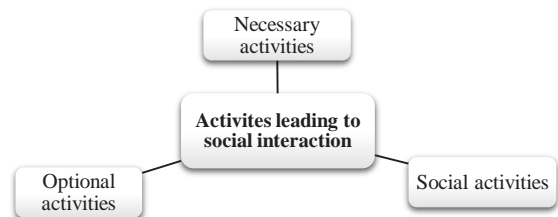
Fig. 1. Factors of creating social interactions from Jan Gehl's Theory

در شکل‌گیری حس تعلق به مکان تأکید می‌کند (Rahimi et al., 2022). فعالیت‌های ضروری آن دسته از فعالیت‌ها هستند که ساکنین به‌طور حتم به انجام آن می‌پردازند مانند رفت‌وآمد درون مجموعه برای ورود و خروج و ... . فعالیت‌های انتخابی آن دسته از فعالیت‌ها هستند که در صورت وجود شرایط مناسب و همین‌طور تمایل خود شخص، صورت می‌گیرد مانند رفت‌وآمد به منزل سایر ساکنین، بازی کودکان، ورزش و ... و در انتها فعالیت‌های اجتماعی که بیشتر از هرچیزی وابسته به حضور سایر ساکنین در فضاهای عمومی و یا برگزاری مراسمات آیینی هستند (Gehl, 2008).