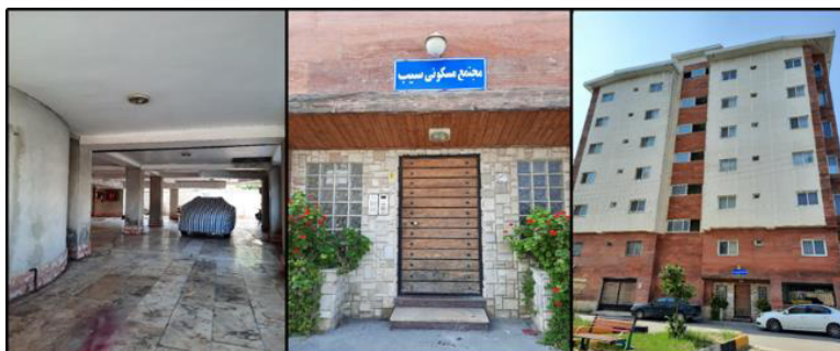
Fig. 3. Sib residential complex

شهرک‌های ویلایی انتخاب شده‌است و در شهرستان نور واقع است. این شهرک حاوی ۵۲ قطعه زمین تفکیک‌شده است که ۴۰ واحد مسکونی ویلایی در آن موجود است. شهرک ساحلی در حدود سال‌های