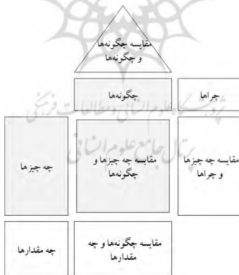
شکل ۳. خانه ارزش‌ها (Prasad 2000)

استقرار عملکرد همزمان ۱ یک چارچوب جایگزین برای استقرار تابع عملکرد ۲ محسوب می‌شود. QFD یک رویکرد چهار-مرحله‌ای است که در ابتدا برای اولویت‌بندی عوامل «کیفیت» محصولات و خدمات در صنایع پیشنهاد شده بود، اما امروزه در موضوعات مختلفی مانند حوزه انرژی، توسعه پایدار، بازاریابی، و آموزش عالی هم به کار می‌رود (De Oliveira et al. 2020). CFD به‌صورت موازی و همزمان، استقرار ارزش‌هایی افزون بر کیفیت را نیز دربرمی‌گیرد. ابزار اصلی هر دو تکنیک، ماتریس رابطه‌ای است که در QFD در قالب خانه کیفیت ۳ و در CFD در قالب خانه ارزش‌ها ۴ تعریف می‌شود. خانه ارزش‌ها مانند آنچه در شکل ۳، آمده در ۸ قسمت (اتاق‌ها و سقف) طراحی شده است که بر اساس سطح پژوهش از هر تعداد آن می‌توان استفاده کرد (Prasad 2000). ماتریس می‌تواند در دو بُعد به‌صورت L و یا در سه بُعد به‌صورت Y ترسیم شود.