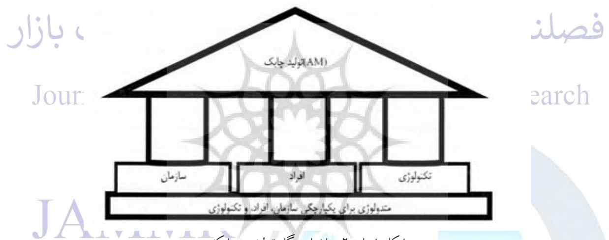
شکل شماره ۲. ساختار بنگاه تولیدی چابک

آرمان «محصولات ما کافی و کامل نیستند و برای ارضای واقعی نیازهای مشتریانمان، ممکن است نیازمند افزودن خدمات ویژه، شرایط ویژه، حمایت فنی و یا افزودن محصولات مکملی که به وسیله شرکت های دیگر، و حتی رقبای ما عرضه می شود، باشیم» آرمان مشترک سازمان های چابک می باشد.