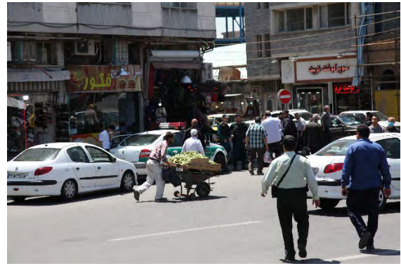
تصاویری از فعالیت دستفروشان در بازار تبریز (نگارندگان).