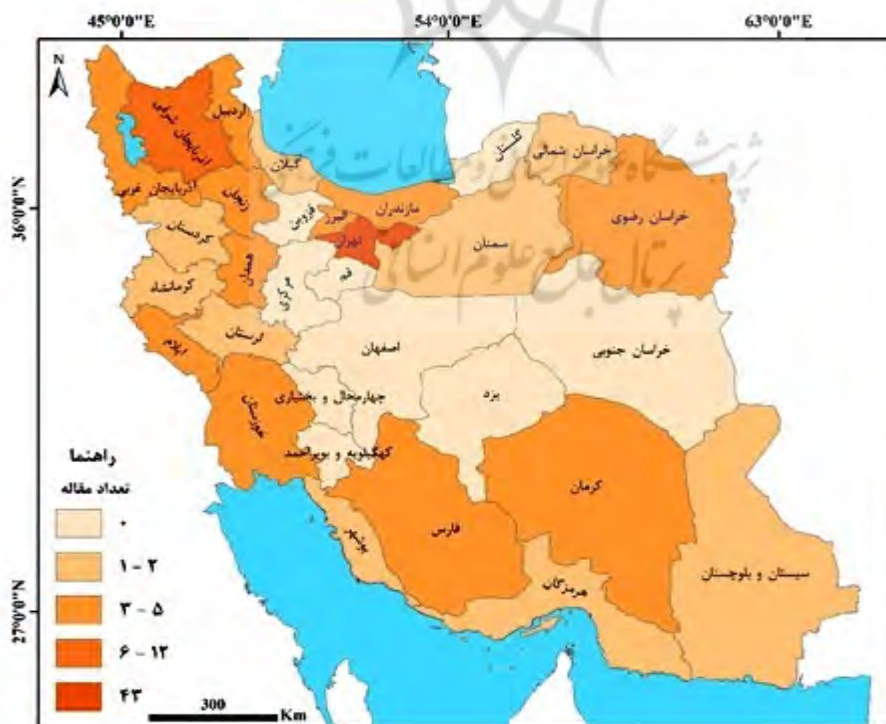
شکل ۴: تعداد پژوهش‌های انجام‌شده در سطح استان‌های ایران

بررسی پراکندگی تعداد مطالعات انجام‌شده در نقشه استان‌های ایران نشان می‌دهد که بیشترین مطالعات مربوط به استان‌های تهران (۴۳ پژوهش) و آذربایجان شرقی (۱۲ پژوهش) است. در استان‌های گلستان، قزوین، قم، مرکزی، کرمانشاه، اصفهان، چهارمحال و بختیاری، کهگیلویه و بویراحمد، یزد و خراسان جنوبی پژوهش با معیارهای موردنظر در این پژوهش یافت نشد (شکل ۴).