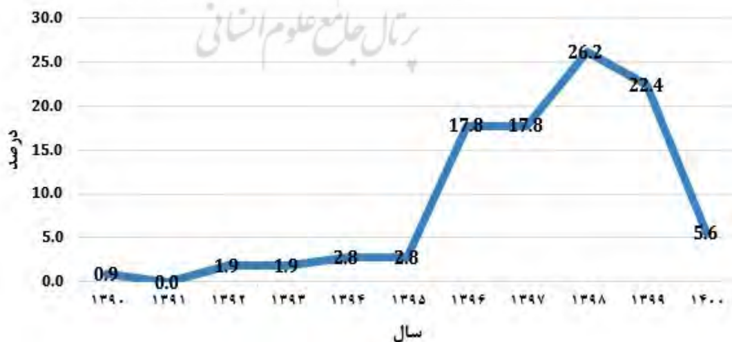
شکل ۲: فراتحلیل پژوهش‌های انجام‌شده بر اساس سال چاپ