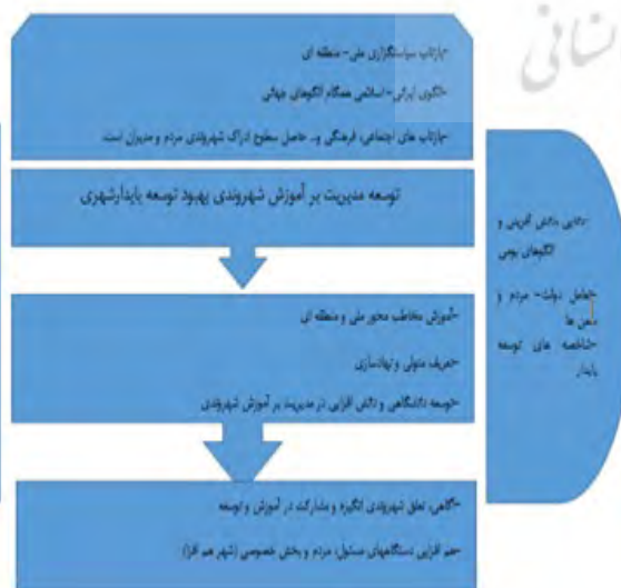
شکل شماره ۱- الگوی مفهومی

راهکارهای تدوین و اجرایی نمودن مؤثر الگوی مفهومی مدیریت بر آموزش شهروندی با رویکرد توسعه پایدار شهری چیست؟ کلیه مراحل تجزیه و تحلیل و تبیین مطالب در قالب کدگذاری محوری و انتخابی که در پژوهش حاضر بر رویکردهای حاصل از داده‌های مصاحبه‌ها صورت گرفته است و در قالب شرایط محوری، علی، زمین‌های، مداخله‌ای، پیامدی و راهبردی می‌باشد در بردارنده پاسخ سؤال سوم پژوهش می‌باشد. در کدگذاری محوری، مفاهیم براساس اشتراکات و یا هم‌معنایی در کنار هم قرار می‌گیرند. به عبارت دیگر، کدها و دسته‌های اولیه‌ای که در کدگذاری باز ایجاد شده‌اند، با یکدیگر مقایسه می‌شوند و ضمن ادغام کدهایی که از نظر مفهومی با یکدیگر مشابهند، دسته‌هایی که به یکدیگر مربوط هستند. در کدگذاری انتخابی، متغیر محوری یا فرایند اصلی حاصل از داده‌ها، مراحل وقوع و پیامدهای حاصل از آن بر مبنای روابط حاصل شده از، مفاهیم بدست آمده از کدگذاری باز و محوری در مرحله کدگذاری انتخابی، به یکدیگر پیوند یافته و به شکل یک الگو در (شکل شماره ۱)، انعکاس یافت.