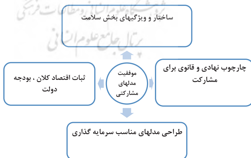
شکل ۱- عوامل موفقیت مدل سرمایه گذاری بر حسب طراحی و عوامل خارجی؛ ماخذ: طراحی مفهومی محقق بر مبنای