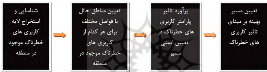
شکل ۲. روش برآورد شاخص کاربری های خطرناک و مدل سازی آن

که در آن AW_i برداری است که از ضرب ماتریس مقایسه دودویی معیارها در بردار W_i (بردار وزن یا ضریب اهمیت معیارها) بدست می آید. در این پژوهش از نرم افزار Expert Choice برای تعیین سازگاری قضاوتها استفاده شده است. بررسی سازگاری قضاوتها در ماتریسهای مقایسه دودویی پارامترهای ایمنی حاکی از آن است که سازگاری در قضاوتها رعایت شده است؛ زیرا 0.1 < C.R. = 0.00307 می باشد.