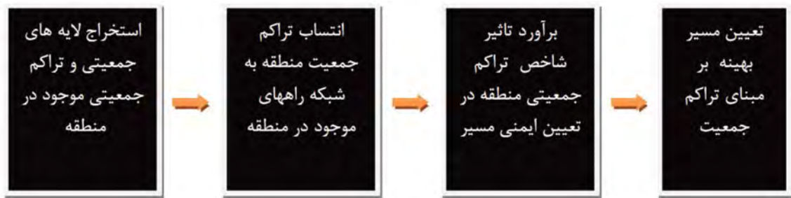
شکل ۴. روش برآورد شاخص تراکم جمعیت و مدل سازی آن