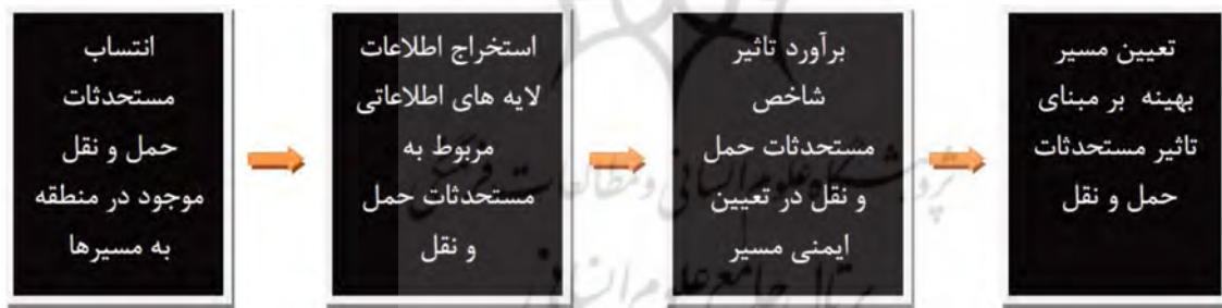
شکل ۳. روش برآورد شاخص مستحذات حمل و نقل و مدل سازی آن