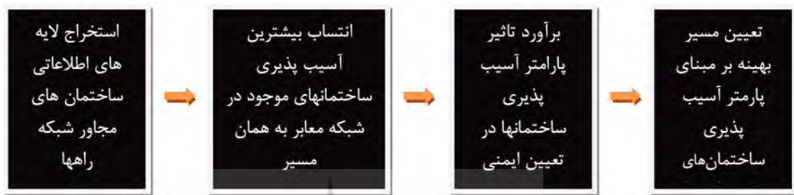
شکل ۵. روش برآورد پارامتر آسیب پذیری ساختمانهای مجاور شبکه معابر و مدل سازی آن

با تحلیل و ارزیابی پارامترهای موثر در ایمنی مسیرهای تخلیه اضطراری در منطقه ۱۵ تهران از طریق مدل تحلیل سلسله مراتبی مسیر بهینه تخلیه اضطراری به لحاظ ایمنی منطقه ۱۵ تهران به صورت شکل ۶ خواهد بود. محل اسکان اضطراری با توجه به فضای باز وسیع موجود در مجاورت منطقه انتخاب شده و مسیرهای ایمن بهینه از تقاطع های اصلی موجود در منطقه تا محل اسکان اضطراری مشخص شده است. شاخص های بسیاری در انتخاب مسیر دخیل می باشند، اما مهم ترین شاخص در انتخاب مسیرهای تخلیه اضطراری، ایمنی می باشد. ایمنی شامل پارامترهای بسیاری می باشد که با توجه به میزان اهمیتشان به ترتیب شامل: ۱. آسیب پذیری ساختمانهای مجاور شبکه راهها و خسارات سنگین وارده به ساختمانها ۲. کاربری های خطرناک ۳. مستحذات حمل و نقل ۴. تراکم جمعیت موجود در بلوک های ساختمانی مجاور شبکه راهها می باشد.