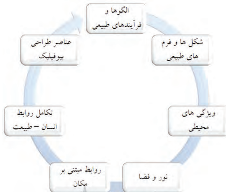
تصویر ۳. عناصر طراحی بیوفیلیک؛ منبع: Kellert, 2008