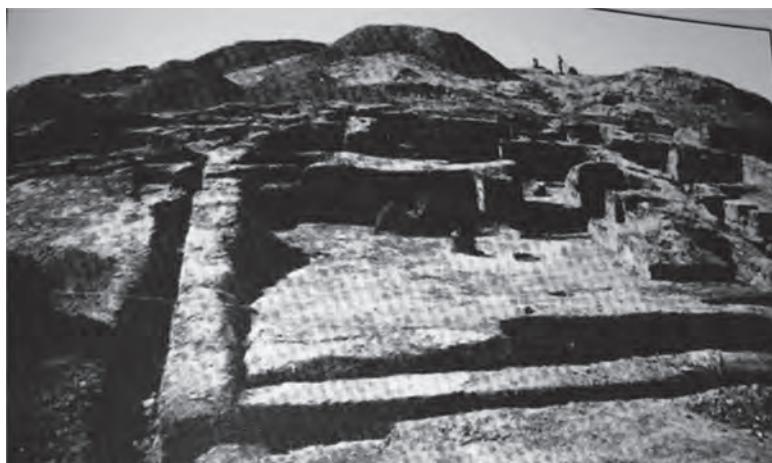
تصویر ۲. ساختمان سوخته؛ ماخذ: اشمیت، ۱۳۹۲.