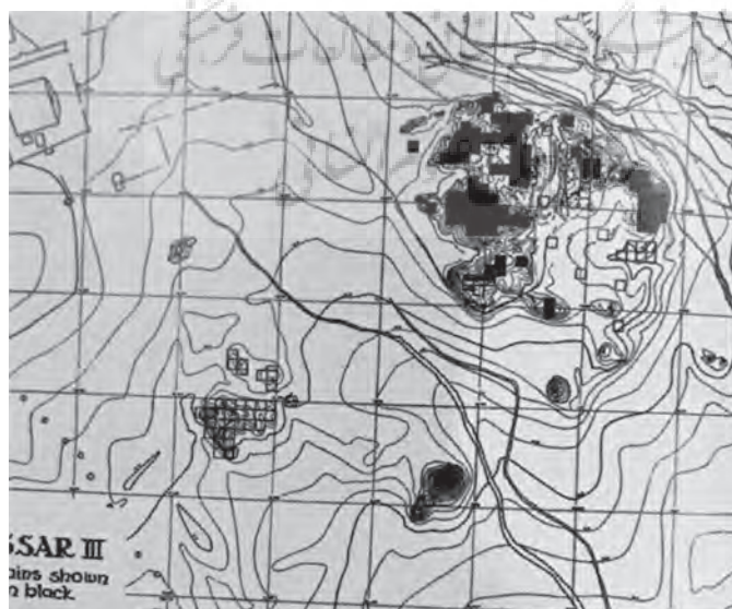
تصویر ۱. نهشته‌های دوره حصار ۳؛ ماخذ: اشمیت، ۱۳۹۲.

و C، تقسیم بندی کرد. هرچند بعدا برخی از پژوهشگران در مورد دوره بندی پیشنهادی اشمیت به دلیل این که مبنای وی برای این کار ظروف سفالی ای بوده که از تدفین ها به دست آورده و جایگاه لایه شناختی آن ها به درستی روشن نیست، تردیدهایی نشان دادند ولی این دوره بندی هنوز به قوت خود باقی است. اشمیت در مورد جایگاه لایه شناختی مرحله های فرهنگی ۴ و ۵ تردید داشت و آنها را به ترتیب مرحله های گذار بین دوره ۱ و ۲، و ۲ و ۳ در نظر گرفت. یکی از اهداف پروژه ی بازنگری حصار در ۱۹۷۶ بررسی درستی دوره بندی پیشنهادی اشمیت بود. هیئت بازنگری طی کاوش های خود توانست به عمیق ترین لایه های حصار که معادل دوره ۱ بود دست یابد، اما با تلفیق داده های لایه شناختی از ترانسه های کاوش شده، ۶ مرحله برای نهشته های بالایی حصار، که معادل دوره های ۲ و ۳ بود، تعریف و از پایین به بالا F تا A نام گذاری کردند؛ سپس این مراحل به زیر مرحله هایی تقسیم بندی دوباره شد. اما تقسیم بندی هیئت بازنگری چندان مورد توجه و ارجاع باستان شناسان قرار نگرفت و دوره بندی اشمیت هنوز اعتبار خود را حفظ کرده است. با وجود این، هیئت بازنگری برای نخستین بار تاریخ گذاری مطلق برای دوره های حصار بر اساس نمونه ذغال های به دست آمده ارائه داد، به این