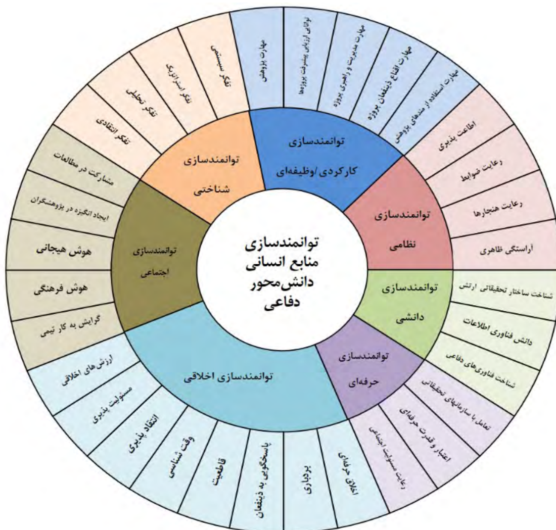
شکل ۱. شبکه مضامین الگوی توانمندسازی منابع انسانی دانشی

جدول ۵ مضامین اصلی الگوی توانمندسازی منابع انسانی دانشی را نشان می‌دهد که از ترکیب این مقوله‌های فرعی، می‌توان مقوله‌های اصلی تشکیل‌دهنده الگو را نشان داد. در شکل ۱ شبکه مضامین مربوط به الگوی توانمندسازی منابع انسانی که از تحلیل تم حاصل شده است.