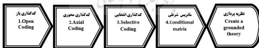
شکل ۱. انواع کدگذاری در روش گراندد تئوری

کدگذاری انتخابی: پدیده موردنظر، ایده و فکر محوری، حادثه، اتفاق یا واقعه‌ای است که جریان کنش‌ها و واکنش‌ها به‌سوی آن رهنمون می‌شوند تا آن را اداره، کنترل و یا به آن پاسخ دهند. پدیده محوری با این سؤال اصلی همراه است که داده‌ها به چه چیزی دلالت می‌کنند؟ مقوله محوری ایده (انگاره، تصور) یا پدیده‌ای است که اساس و محور فراگرد است. این مقوله همان عنوانی (نام یا برجسب مفهومی) است که برای چارچوب یا طرح به وجود آمده در نظر گرفته می‌شود. مقوله‌ای که به‌عنوان مقوله محوری انتخاب می‌شود باید به‌قدر کافی انتزاعی بوده و بتوان سایر مقولات اصلی را به آن ربط داد. اما هدف موردنظر در این تحقیق دستیابی به ابعاد و مؤلفه‌ها از بیانات و اندیشه‌های امام خامنه‌ای (مدظله‌العالی) در حوزه استقلال و آزادی می‌باشد لذا تحقیق حاضر به نظریه‌پردازی ختم نمی‌شود. روش‌های علوم انسانی و مطالعات فرهنگی ویژگی‌های انتخاب مقوله محوری را موارد زیر بیان می‌کند: