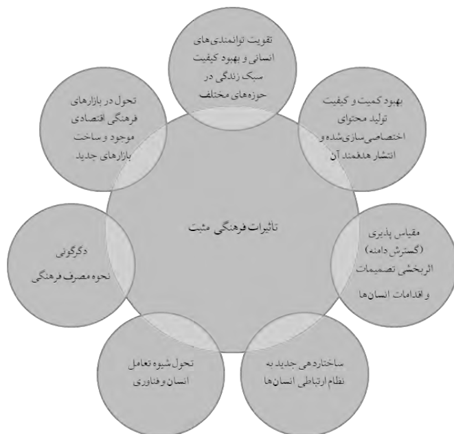
شکل ۱. الگوی تأثیرات فرهنگی مثبت