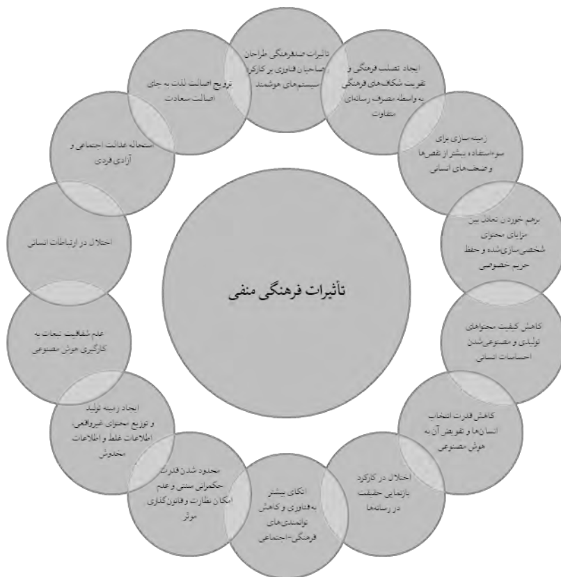
شکل ۲. الگوی تأثیرات فرهنگی منفی

ایجاد اثر اکو و بزرگ‌نمایی محتواها، ایجاد حباب ذهنی برای افراد و حذف ارتباطات با خطوط فکری متفاوت، ایجاد اتاق‌های پژواک و تقویت شکاف فرهنگی، ایجاد آبشار اطلاعاتی و قلب واقعیت، همگی منجر به درگیر شدن بیشتر و گسترده‌تر با تهاجم فرهنگی و استحاله فرهنگی می‌شوند و درنهایت «ایجاد تصلب فرهنگی و تقویت شکاف‌های فرهنگی» را به همراه خواهند داشت.