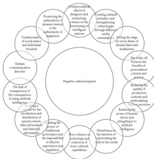
Figure 2. Negative cultural impacts