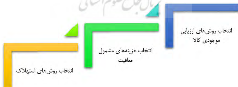
شکل ۲. برخی مصادیق کاربردی حسابداری خلاقانه

بر اساس این تعاریف، موضوع قابل توجه این است که حسابداری خلاقانه فرایندی است تابع انتظارات مدیریت تا با تبدیل اطلاعات مالی واقعی به اطلاعات نادرست، نسبت به برآوردن اهداف و رضایت صاحبان منافع اقدام لازم را انجام دهند. لذا مدیران با فشار بر واحد حسابداری تلاش می‌کنند تا صورت‌های مالی را آنگونه انعکاس دهند که نقض استانداردها و قوانین صورت نگیرد و از این طریق منافع آنان تأمین شود. لذا هوشمندی در استفاده از انعطاف‌پذیری قوانین یا استانداردها همانند، کاهش هزینه‌ها به واسطه انتخاب از میان روش‌های موجود استهلاک در تعیین هزینه استهلاک سالانه؛ اجتناب مالیاتی به واسطه شناسایی هزینه‌های تحقیق و توسعه و یا انتخاب روش‌های ارزیابی موجودی کالا که به بیش ارزش‌گذاری منجر می‌شود می‌تواند مبنای کاربردی حسابداری خلاقانه تلقی گردد.