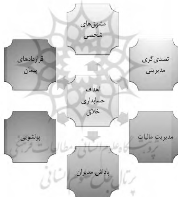
شکل ۱. اهداف حسابداری خلاقانه

باعث انعکاس اخبار و اطلاعات تحریف شده نتایج به نفع صاحبان قدرت در شرکت و به ضرر استفاده‌کنندگان برون سازمانی می‌گردد. از طرف دیگر، حسابداری خلاقانه معمولاً با عارضه ناشی از فرصت‌طلبی بیش از حد در استفاده از روش‌های جدید برای توصیف درآمد؛ دارایی یا بدهی مواجه است که هدف آن تأثیرگذاری بر استفاده‌کنندگان و دستکاری تفسیرهای آنان هم‌سو با اهداف صاحبان قدرت می‌باشد (سوپریا و ویدھی ۱ ، ۲۰۱۸). مرور ریشه‌های واحد این مفهوم در حسابداری نشان می‌دهد، اصطلاحات «ابتکاری» یا «تهاجمی» به تنوع در توصیف این شیوه از حسابداری توسط پژوهش‌هایی همچون آمات و گوئورپ ۲ (۲۰۰۴) و سرنوسکار و همکاران ۳ (۲۰۱۶) بکار برده شده است که نشان می‌دهد این مفهوم، تقریباً به دلیل فقدان ابعاد مشخص، نوظهور است و زمینه‌های شکل‌گیری آن مشخص نمی‌باشد. هدف اصلی برای ایجاد حسابداری خلاقانه «تحریف واقعیت‌ها از طریق دستکاری سود و یا هزینه‌های شرکت می‌باشد که باهدف برآورده ساختن منافع تملک‌طلبانه گروهی از افراد دارای قدرت صورت می‌گیرد (عسگری و همکاران، ۱۳۹۸). سوسماس و درمیرهان ۴ (۲۰۲۰) اهداف حسابداری خلاقانه را به‌ترتیب زیر ارائه دادند.