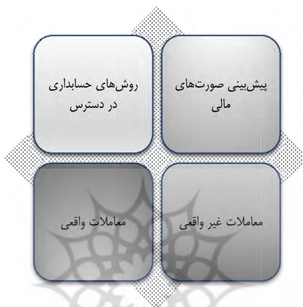
شکل ۳. شیوه‌های حسابداری خلاقانه

از طرف دیگر صالح و همکاران (۲۰۲۱) دلایل ترویج و ترغیب مدیریت به استفاده از حسابداری خلاقانه را شامل نشان دادن یک روند ثابت رشد در سود یا همان هموارسازی سود جهت کمک به دستیابی تحلیلگران مالی به پیش‌بینی رضایت بخش؛ پنهان کردن اخبار بد و حفظ پایداری قیمت سهام می‌داند. همچنین شیوه‌های حسابداری خلاقانه را بر اساس ۴ بعد زیر بیان می‌کنند: