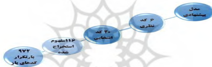
شکل (۱). روند کدگذاری

در بخش تحلیل مصاحبه‌ها، به منظور کدگذاری باز، تمامی مصاحبات در نرم‌افزار Atlas-ti وارد شده‌اند. در مرحله کدگذاری باز، داده‌ها به کوچک‌ترین واحد خود خرد شده و خط به خط داده‌ها بازنگری می‌شود تا حداکثر کدهای ممکن شناسایی گردد. بعد از شناسایی کدهای باز، یکی از کدهای باز به‌عنوان مقوله اصلی انتخاب می‌شود و سایر کدهای اصلی، به عنوان کدهایی در نظر گرفته می‌شوند که ممکن است ویژگی مقوله اصلی را داشته یا با آن مرتبط باشد. در این مرحله از کدگذاری صرفاً برای مقوله اصلی و مقولات مرتبط صورت می‌گیرد و دیگر داده‌های نامرتب با مقوله اصلی در نظر گرفته نمی‌شوند. در مرحله یادداشت‌برداری نیز، هم‌زمان با گردآوری داده‌ها پیوسته اندیشه‌ها و تفاسیر خود از تعامل با داده نیز ثبت گردید، در مرحله مرتب‌سازی داده‌های مرتبط در کنار همدیگر و داده‌های نامرتب مجدداً حذف می‌شوند و در مرحله کدگذاری نظری، داده‌ها و مقولات مرتبط که در کنار هم قرار گرفتند در قالب مفاهیم معنادار ذکر شد، مفاهیم بدست آمده با ادبیات و پیشینه پژوهش مورد بررسی قرار گرفته و از دل این بررسی‌ها، نظریه طراحی و تدوین گردید. در مجموع این بررسی‌ها، ۱۱۶ مفهوم و از آن میان، ۲۰ مقوله و ۶ کد نظری شناسایی و استخراج شد. فروانی مفاهیم و مقوله‌ها در شکل زیر نشان داده شده است: