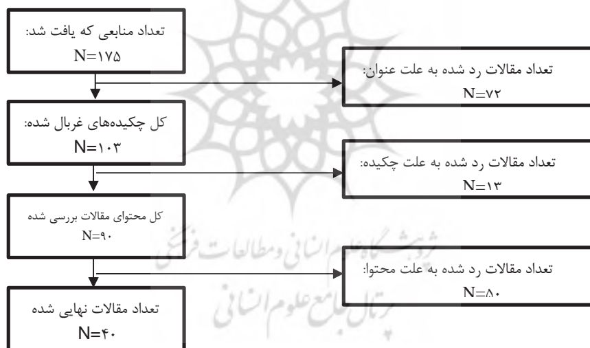
شکل ۲- شیوه‌ی انتخاب و ارزیابی مقاله‌های مناسب جهت تحلیل

• تجانس بین پارادایم‌های هدایت‌کننده پروژه پژوهش‌های با روش‌های انتخاب شده در طول این پژوهش، محققین به بررسی هر یک از مطالعات پرداختند و طی مباحثات و مبادلات به این توافق رسیدند که مطالعات از کیفیت لازم برخوردارند. مقالات بر اساس معیارهایی بر اساس فرآیند نمایش داده شده در شکل (۲) حذف یا انتخاب شدند. معیارهای پذیرش یا عدم پذیرش، شامل مواردی چون محدوده‌ی جغرافیایی، زبان مطالعات، زمان مطالعات، روش‌های مطالعات، جامعه مورد مطالعه، شرایط مورد مطالعه و نوع مطالعه است. بسیاری از مقالات حذف شدند چرا که آن‌ها معیارهای انتخاب را برآورده نمی‌کردند. با توجه به ماهیت پژوهش مقالات غیرمرتبط با زمینه پژوهش از این مطالعه کنار گذاشته شدند. در پایان ۴۰ مقاله مربوط به موضوع، یا اشاره داشته به بخشی از موضوع انتخاب شد.