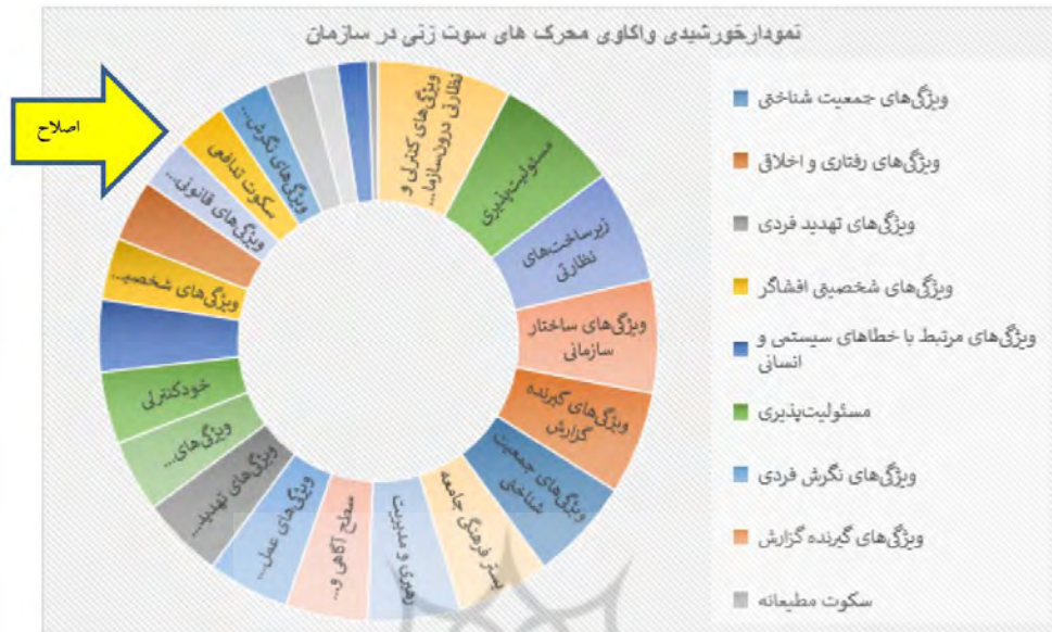
شکل ۲. هیستوگرام واکاوی محرک‌های سوت‌زنی در سازمان