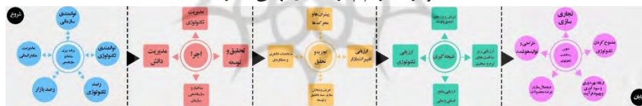
شکل شماره (۱): مدل مفهومی الگوی نقشه راه تکنولوژی انقلاب صنعتی چهارم

شتاب در رشد تکنولوژی و قابلیت های منحصر به فرد آن در دهه های اخیر آن را به عاملی مهم در کسب مزیت رقابتی و موفقیت کسب و کارها و پاسخ به تحولات گوناگون تبدیل نموده است. به کارگیری تکنولوژی در راستای اهداف سازمانی، نیازمند سازگاری و تعامل دوطرفه میان برنامه ریزی تکنولوژی و برنامه ریزی سازمان جهت توفیق در توانمندی کسب و کار است. هدف از توانمندسازی تسهیل دستیابی به اهداف سازمانی از طریق ارائه بهترین منابع فکری مرتبط با زمینه های گوناگون عملکرد سازمان است. با توجه به نقش مهم تکنولوژی در تحولات زندگی بشر، رصد و شناسایی و اکتساب و پیاده سازی تکنولوژی های نوظهور دارای اهمیت است. سپس مدیریت تکنولوژی که به معنای دستیابی به تکنولوژی از طریق تحقیق و توسعه و یا انتقال تکنولوژی، و استفاده از آن در محصولات و خدمات سازمان ها با هدفی خاص مطرح می باشد. در مرحله بعدی مدیریت دانش و سرمایه های فکری بررسی شده و در ادامه بخش تحقیق و توسعه سازمان در راستای شناسایی و انتخاب و اکتساب و بهره برداری از تکنولوژی، جهت هم راستایی سازمان با تحولات حاصل از تکنولوژی در کسب و کار و تبدیل سازمان از شکل سنتی به مدرن مورد توجه قرار گرفته است.