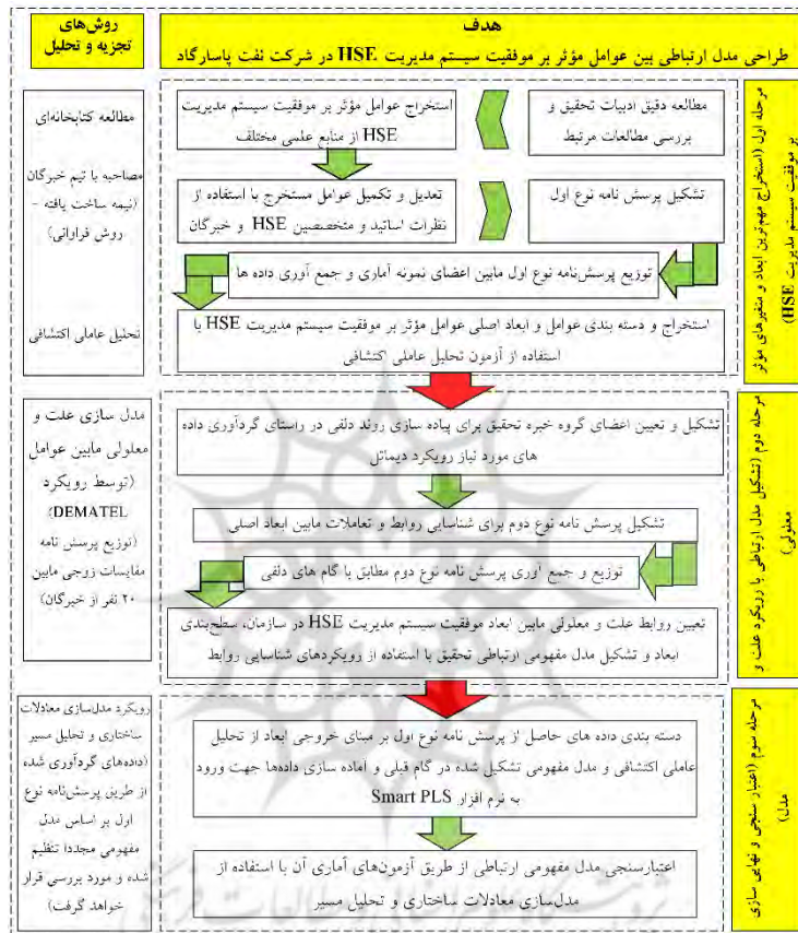
شکل شماره (۱): مراحل روش و ابزار گردآوری داده‌ها

مرحله اول: شناسایی و استخراج متغیرها و ابعاد مؤثر بر موفقیت سیستم مدیریت سلامتی، ایمنی و محیط زیست. مرحله دوم: طراحی و تدوین مدل ارتباطی مابین عوامل مؤثر بر موفقیت سیستم مدیریت سلامتی، ایمنی و محیط زیست در شرکت نفت پاسارگاد. مرحله سوم: اعتبارسنجی مدل ارتباطات مابین عوامل (حاصل از مرحله دوم) و حصول مدل نهایی و تست شده از طریق رویکردهای آماری موسوم به تکنیک معادلات ساختاری (SEM) ۲ و تحلیل مسیر ۳ . در یک جمع‌بندی، روش‌های تجزیه و تحلیل اطلاعات به تفکیک مراحل انجام تحقیق در قالب شکل (۱) قابل ارائه می‌باشد.