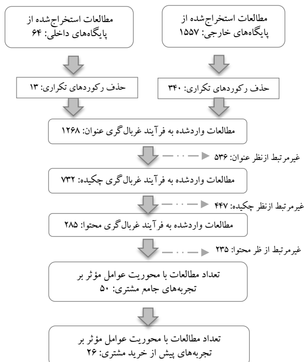
شکل ۱: روند غربال‌گری و گزینش مطالعات

است. در نهایت، در ۵۰ مقاله به عوامل مؤثر بر تجربه‌های جامع مشتریان تأکید شده که از میان آنها تنها در ۲۶ مقاله بر تجربه مشتریان در نقاط تماس پیش از خرید تمرکز شده بود. به همین دلیل، فقط ۲۶ مقاله مبنای استخراج کدها قرار گرفت. همچنین، در پژوهش حاضر برای اطمینان از کیفیت فراترکیب، مطالعات نهایی براساس معیارهای برنامه ارزیابی مهارت‌های حیاتی CASP (معیارهای ده‌گانه وضوح و شفافیت هدف‌های پژوهشی، تناسب روش‌شناسی، طرح پژوهش، رویکرد نمونه‌گیری، گردآوری داده، کنترل انعکاس‌پذیری و سوءگیری محقق، الزام به استانداردهای اخلاقی، دقت و اعتبار شیوه‌های تحلیل داده، وضوح گزارش‌دهی نتایج و ارزش پژوهش) ارزیابی شد. سرانجام، تمامی پژوهش‌ها با اکتساب حداقل امتیاز ۳۰ (از مجموع امتیاز ۵۰) سطح کیفی پذیرفتنی داشتند.