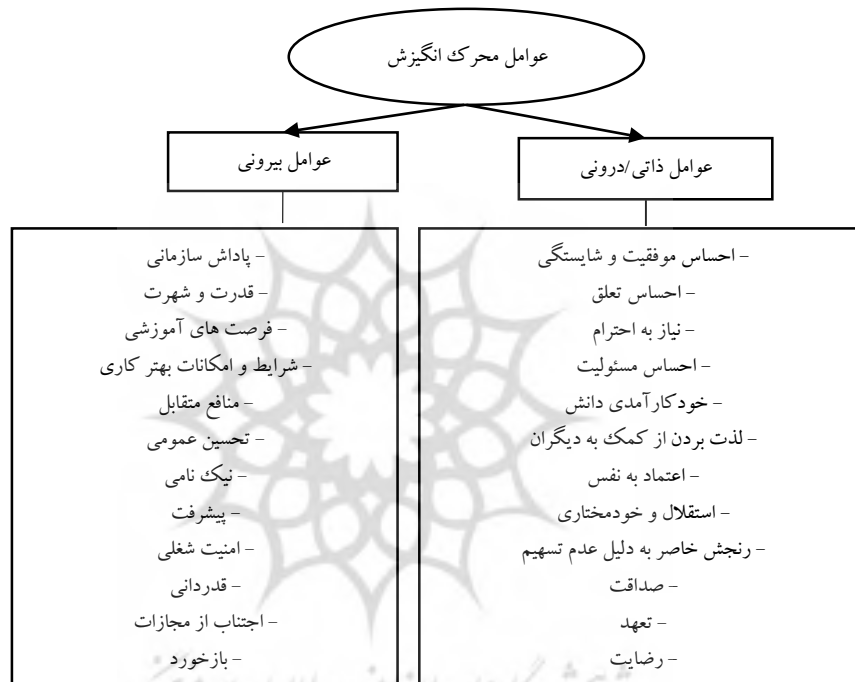
شکل ۲. مدل تریسمی انگیزش در حسابداران بخش عمومی

محیطی برای شروع کردن یا ادامه دادن یک فعالیت است. این نوع انگیزش وسیله‌ای است برای هدف. عوامل انگیزش بیرونی نظیر تحسین عمومی، امنیت شغلی، قدردانی، نیک نامی بر اساس ملموس و یا ناملموس بودنشان در الگو طبقه‌بندی می‌شوند. شرایط زمینه‌ای: کلیه مقوله‌های محوری در شرایط زمینه‌ای صورت می‌گیرد که بستر کلیه راهبردها، اجرا و کنترل نسبت به پدیده مرکزی است. بنابراین، مقوله مرکزی این پژوهش در شرایط زمینه‌ای خاصی اتفاق می‌افتد که با انجام مصاحبه‌ها از خبرگان و بررسی دقیق داده‌های گردآوری شده توسط محقق و مقوله‌های دسته‌بندی شده و نیز دریافت مجدد نظر خبرگان، ماهیت بخش عمومی مشکل از «ویژگی‌های ذاتی بخش عمومی» و «ویژگی‌های عملیاتی بخش عمومی» به همراه «عوامل فرهنگی» به‌عنوان شرایط زمینه‌ای مقوله مرکزی است.