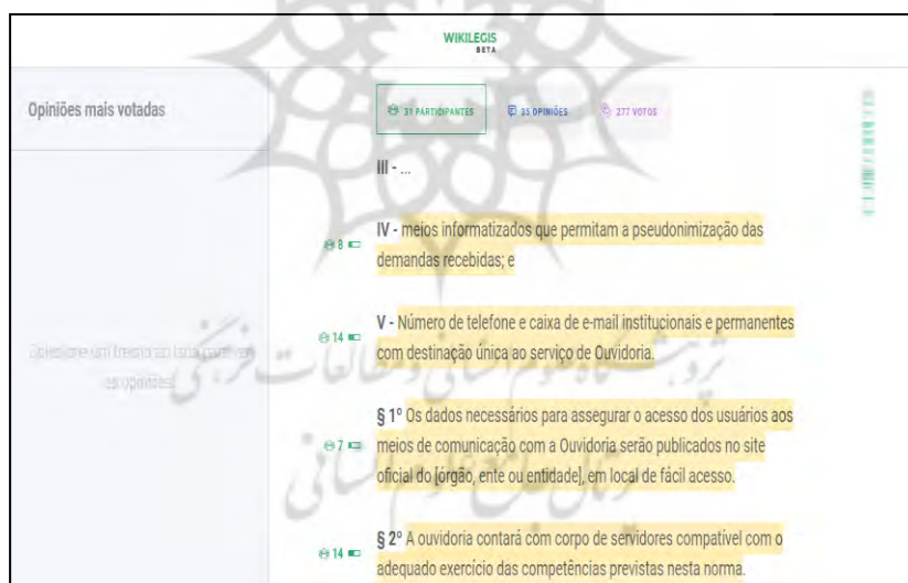
شکل ۱- تصویری از مشارکت شهروندان برزیلی در پلت‌فرم Wikilegis و ویژگی‌های آن

برای بهترین پیش‌نویس(ها) در نظر گرفته می‌شود و این جایزه، هزینه به‌مراتب کمتری نسبت به آنچه را که یک قرارداد به دولت تحمیل می‌کند، در بردارد. مشارکت‌جویان هیچ‌گاه نسبت به نگارش جملات و حتی واژگان پیش‌نویس، سهل‌انگاری نخواهند کرد، چرا که مستقیماً منافع و منابع آنان را تحت تأثیر قرار می‌دهند. علاوه بر آن در این روش، می‌توان از تمام مزایای موجود در خرد جمعی بهره برد، نظیر: تجارب، اندوخته‌های پراکنده دانش، منافع اقشار مختلف و غیره (Aitamurto، Collective Intelligence in Law Reforms: When the Logic of the Crowds and the Logic of Policymaking Collide، 2016، p.2784). قانون‌سپاری به دلیل مشارکت بخشیدن به شهروندان، آنان را در مسائل و امور حیاتی و مهم جامعه دخیل می‌کند، و این دخالت ۱ ، منجر به رشد آگاهی‌ها و شعور سیاسی-حاکمیتی آن شهروندان خواهد شد.