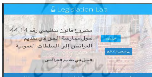
شکل ۲- نمایی از پلت‌فرم Legislation Lab

مثالی دیگر از پلت‌فرم‌های قانون‌سپاری LegislationLab پایگاهی اینترنتی است. علت تأسیس این پلت‌فرم این است که شهروندان بتوانند در فرایندهای قانون‌گذاری سهیم باشند. Legislation Lab به عنوان بستری برای تشویق مردم به آگاهی یافتن از قوانین و نقش‌آفرینی در قانون‌گذاری مطرح شده است. این پلت‌فرم در پی ارائه راه‌های دسترسی آسان به قانون‌گذاری است. به علاوه، برای جمع‌آوری بازخوردهای مردمی نیز مهیاست. در این پلت‌فرم، اطلاعات کاربران پردازش شده و میزان مشارکت در اقشار مختلف اعم از زن و مرد و یا به تفکیک بازه‌های سنی و مناطق جغرافیایی و یا صاحبان مشاغل گوناگون قابل‌رؤیت است. شهروندان می‌توانند هرگونه تغییری در متن‌های پیشنهادی اعمال کنند، از جمله: تغییر در واژگان، اصطلاحات، عبارات، جملات و همچنین مواد پیش‌نویس قانون، بحث‌هایی چندجانبه پیرامون مواد قانونی و نظردهی، حاشیه‌نویسی بر پیش‌نویس و بیان دیدگاه‌ها، تعیین قسمت‌های ویژه، پیشنهاد جایگزین‌های مدنظر و غیره (حاکمی، ۱۳۹۶).