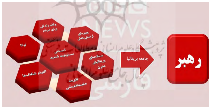
شکل ۲: استخراج مقوله کلی از مضامین اولیه ،

از پنج مضمون اولیه شامل مادر بزرگ، مادری فداکار، مادر بسیار عزیزمان، مادری توانا و غم و اندوهی بزرگ، به نظر می رسد سایت بی بی سی فارسی تلاش کرده است تصویری از معنای مادر در مرکز یک خانواده را در ذهن مخاطب شکل بدهد. بار معنایی چنین مضمونی البته می تواند با کمترین مقاومتی در ذهن مخاطب جای بگیرد.