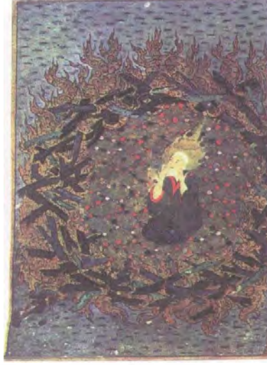
تصویر شماره ی ۳