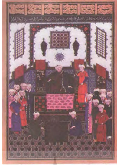
تصویر شمارہ ی ۵

پرویش گاہ علوم انسانی و مطالعات فرہنگی پرتال جامع علوم انسانی