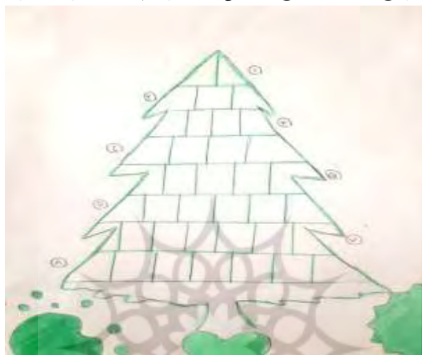
شکل (۳)- جدول سرگرمی به شکل درخت کاج