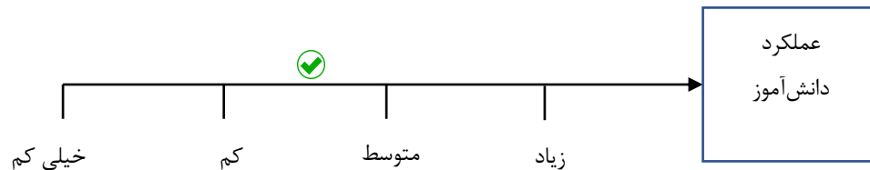
شکل (۲) مقیاس درجه‌بندی نگره‌ای شماره ۲

صدایش کمی واضح‌تر شده بود و کلمات را جا نمی‌انداخت و همچنین تعداد دفعاتی که صدایش را صاف می‌کرد نیز به مراتب کمتر شده بود. در این پادکست دانش‌آموز یکی از حکایت‌های کتاب را با انتخاب خودش ارسال کرد.