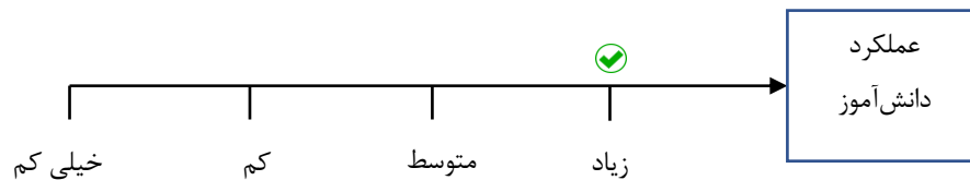
شکل (۳) مقیاس درجه‌بندی نگاره‌ای شماره سه (بعد از ساخت پادکست آخر)

موش انتخاب شد. در این صوت ارسالی، تلاش دانش‌آموز برای دقیق خواندن و آرام خواندن مشهود بود. از او درخواست کرده بودم که سعی کند با آرامش و شمرده شمرده بخواند.