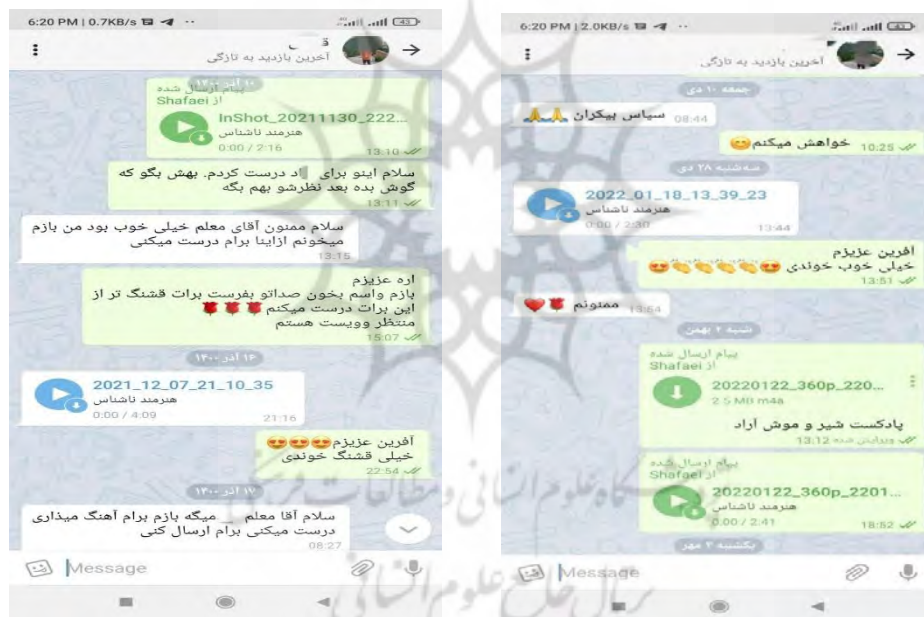
تصویر (۱) پادکست شماره ۱ و ۲