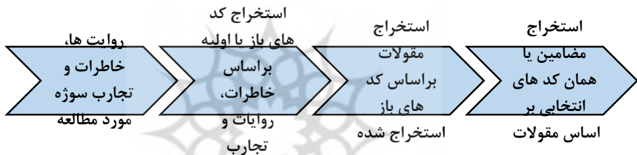
شکل ۱. مدل مفهومی فرآیند استخراج مضامین و مقولات

یکی از راه‌های تحلیل داده‌ها در پژوهش روایی، مشخص کردن تم‌ها و عناوین اصلی است (عطاران، ۱۳۹۶). ما در این پژوهش، از روش تحلیل مضمون (برای تحلیل داده‌ها استفاده کرده ایم. روش تحلیل مضمون روشی است برای تحلیل الگوهای موجود در داده‌های کیفی به ویژه داده‌هایی که از نوع متنی هستند (نودهی و بدری، ۱۴۰۱). این روش به منظور شناخت، تحلیل و گزارش الگوهای موجود در داده‌ها کاربردهای فراوانی دارد (Clarke & Braun, ۲۰۰۶). ما با این روش در ابتدا یکسری کدهای باز را از روایت‌ها، خاطرات و تجارب راوی جمع‌آوری کرده و در ادامه از طریق آن کدها به یک سلسله از مقولات رسیدیم و در انتها از آنها مضامین اصلی را استخراج کرده و سپس در بخش نتیجه به تحلیل مهم‌ترین مضامین و مقولات که در انتخاب دانشگاه فرهنگیان توسط راوی موثر بوده است پرداختیم. در زیر یک مدل مفهومی از نحوه استخراج مضامین و مقولات آمده است.