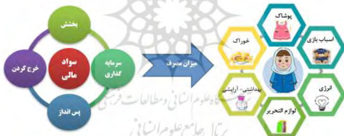
شکل ۱: نقشه مفهومی پژوهش

پژوهش حاضر درصدد است، با برگزاری یک دوره آموزشی سواد مالی به روش GISS پاسخی برای این پرسش بیابد که آیا آموزش سواد مالی به روش مذکور به بهبود کاهش مصرف‌گرایی منجر می‌شود؟ نقشه مفهومی این پژوهش در شکل (۱) آورده شده است.