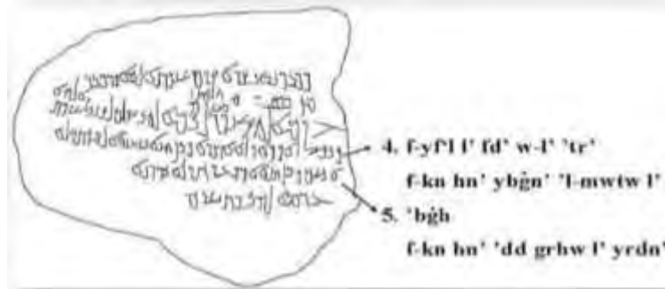
شکل ۲. تقدیم به عبوداس، عین العبد، عین عبدات (جنوب فلسطین)، حدود قرن دوم میلادی