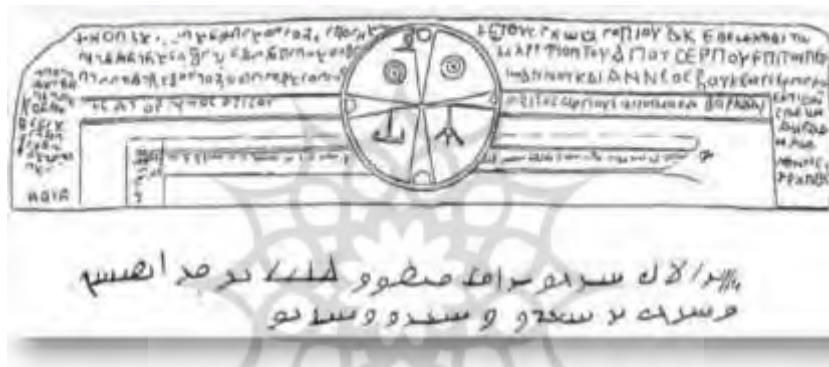
شکل ۳. یادداشت‌های سوریه، حدود ۵۱۲ میلادی