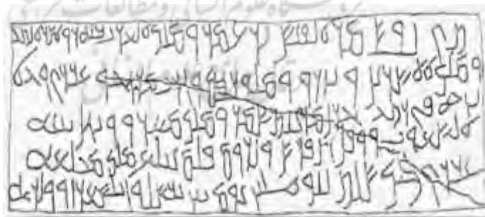
شکل ۱: سنگ دراز امروالقیس، نمارا (جنوب سوریه) ۳۲۸ میلادی