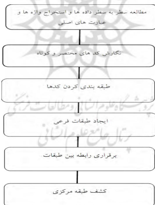
شکل ۱. مدل مفهومی روش تحقیق

در پژوهش حاضر مقاتل مورد بررسی قرار گرفت و از بین آنها پژوهش روی ۵ مقتل اصلی که بر اساس قدمت تاریخی و معتبر بودن اسناد آن کار پژوهش صورت گرفت که عبارتند از: مقتل ابی مخنف، نفس المهموم، مقتل ابن مقرم، مقتل شیخ مفید، مقتل لهوف.. همچنین در این پژوهش برای گردآوری داده‌ها از روش سند کاوی استفاده شده است. بر این اساس، کلیه کتاب‌ها، مدارک، اسناد، پایگاه‌ها، مقاله‌ها و پژوهش‌های در دسترس پژوهشگر که به بررسی این مفاهیم پرداخته‌اند، مورد مطالعه قرار گرفته و از آن‌ها فیش برداری شده است. ابتدا مقاتل قدیمی و نسخ اصلی و همچنین کتب و مقالات کلیدی در زمینه موضوع شناسایی و به صورت داده در نظر گرفته شد. سپس با مطالعه این متون، مؤلفه‌ها و عناصر تربیتی امام حسین علیه‌السلام در واقعه عاشورا استنتاج گردید نحوه استخراج الگوی تربیتی از خطبه‌های حضرت امام حسین علیه‌السلام را شرح داده است: