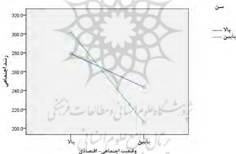
شکل ۱. اثر تعاملی وضعیت اجتماعی و سن آزمودنی‌ها در مورد متغیر رشد اجتماعی