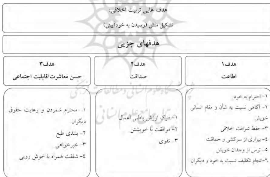
شکل (۱) اهداف تربیت اخلاقی و اجتماعی از دیدگاه کانت

به این ترتیب، هدفهای غایی و جزئی تربیت اخلاقی و اجتماعی از دیدگاه کانت را می‌توان در شکل (۱) نمایش داد: