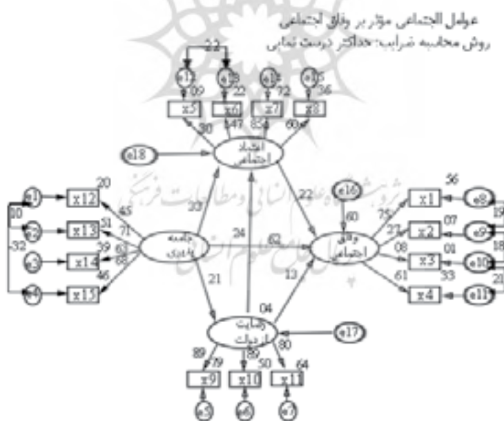
شکل (۲) مدل معادلات ساختاری در حالت تخمین استاندارد

کای اسکوئر بهنجار و نسبی ( \chi^2/df ): یکی از شاخصهای عمومی برای به حساب آوردن پارامترهای آزاد در محاسبه شاخص برازش، کای اسکوئر بهنجار یا نسبی است. اغلب اندیشمندان مقادیر بین ۲ تا ۳ را برای این شاخص قابل قبول می‌دانند. شاخص برازش تطبیقی (cfi): مقدار یکسانی برای قابل قبول بودن مدل برای این شاخص ذکر نشده است اما مقدار ۰/۹ به بالا قابل توافق است.