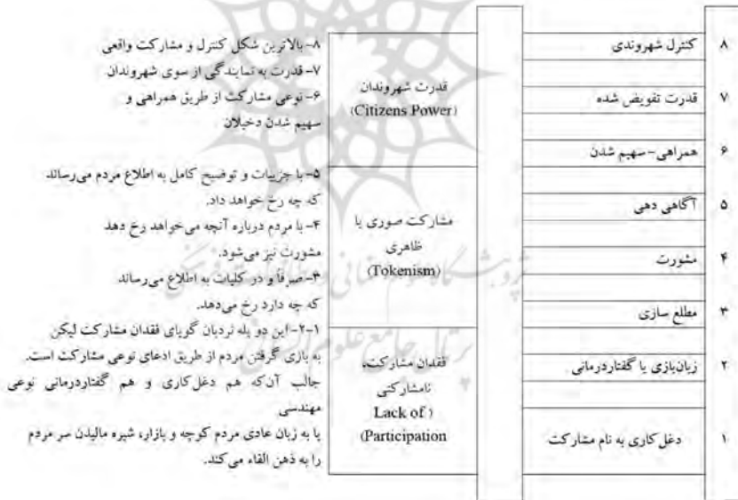
تصویر ۱- نردبان مشارکت شری ارنشتین (منبع: آموزه‌های بازآفرینی شهری پایدار؛ پرویز پیران)

شری ارنشتین ۱ مشارکت را محدود به آن دسته از فعالیتهای جمعی یا کنشهای گروهی می داند که با میزانی از اقتدار، نظارت، هدایت و کنترل مشارکت کنندگان همراه است. مشارکت اسم رمز آینده ایران است. پیش شرط مشارکت نیز پذیرش حقوق انسانی و اجتماعی کسانی است که شهروندان ایران هستند. در واقع «پایداری» و «شهروندمداری» راهبردهای مادر و بدون جایگزین جامعه ایران و شهر ایرانی است. تصویر زیر نردبان مشارکت شری ارنشتین را نشان می دهد.