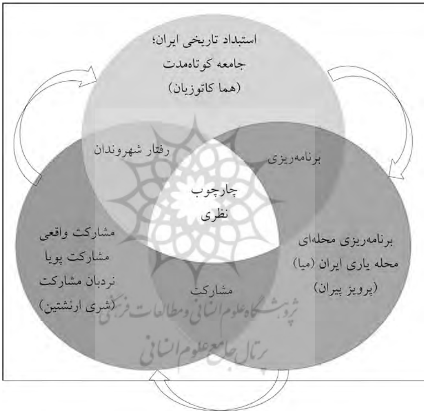
تصویر ۲- دیاگرام چارچوب نظری پژوهش (منبع: نگارندگان)

است که انتخاب و معرفی نظرات مربوطه صرفاً برای وضوح و شفافیت بیشتر مسیر و فرایند تحقیق بوده است و بدین معنا نیست که سایر نظریه‌های ارائه شده در مبانی نظری بلااستفاده است، برعکس آنچه در پیچه فکری نگارندگان را در مواجهه با الگوهای مشارکتی شهروندان ساکن در محله بلاغی قزوین گشوده است، تلفیق و ترکیبی از نظریات مزبور است.