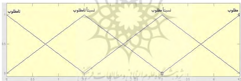
شکل (۱) گزاره‌های زبانی فازی در یک متغیر کیفیت زندگی

در اینجا مقدار \mu_A(x) عبارت از مقدار عضویت یا درجه عضویت است، که بیانگر درجه تعلق x به مجموعه فازی است. هر چه مقدار \mu_A(x) به یک نزدیکتر باشد، درجه تعلق عنصر x به مجموعه فازی بیشتر است و اگر \mu_A(x) = 0 باشد آنگاه می‌گوییم عنصر x به مجموعه فازی A اصلاً تعلق ندارد. یک تابع عضویت می‌تواند هر شکلی را براساس تعریف و ماهیت مسئله توسط طراح از نقطه نظر سادگی، سرعت و کارایی به‌خود بگیرد (الجراح و ابوقدیس، ۲۰۰۶). در واقع یکی از ویژگی‌های اساسی منطق فازی، در استفاده از ساختار قانون پایه است که در طی آن مسائل کتتری به یک سری قوانین \text{If } x \text{ And } Y \text{ Then } z تبدیل می‌شوند که پاسخگوی خروجی مطلوب سیستم برای شرایط ورودی داده شده به سیستم می‌باشد. این قوانین ساده و آشکار برای توصیف پاسخ‌دهی مطلوب سیستم با اصطلاحاتی از متغیرهای زبان شناختی به‌جای فرمول‌های ریاضی استفاده می‌شوند. به عبارتی منطق فازی می‌خواهد با استفاده از طیفی از عضویت (از صفر تا یک) گزاره‌های زبانی را شبیه سازی کند. یک تابع عضویت متغیر زبانی کیفیت زندگی را می‌توان به شکل زیر نمایش داد (شکل ۱ و جدول ۲).