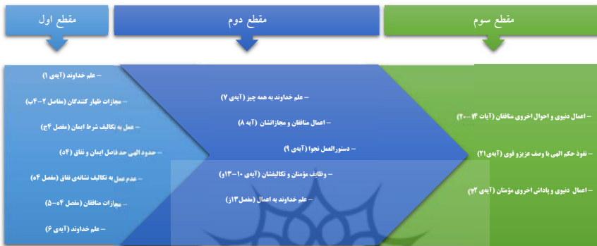
شکل ۱- خلاصه‌ی عناوین مطرح در مقاطع سه‌گانه‌ی سوره

مقاطع سه‌گانه‌ی این سوره با الگوی چینش نظم محوری، در ذیل یک سلسله به وسعت کل سوره قرار می‌گیرند و لذا شناسایی نظم حاکم بر این مقاطع، ناظر به شناسایی نظم حاکم بر کل سوره است. به منظور کشف این نظم، الگوی چینش آیات در هر سه مقطع، جهت قیاس و نتیجه‌گیری، مطابق شکل به تفکیک کنار یکدیگر قرار داده می‌شود.