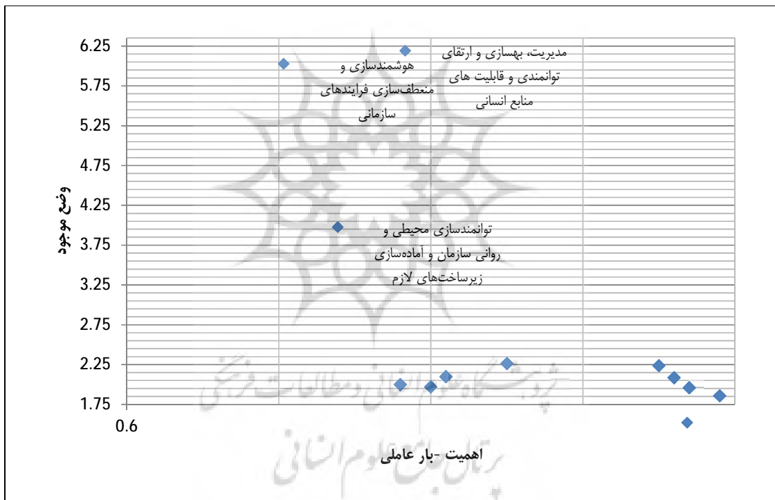
شکل 3. اولویت‌بندی مضامین فراگیر

با توجه به جدول 4، می‌توان نتیجه گرفت که انحراف استاندارد و میانگین نمونه، وضعیت خوبی دارد و هر پنج سازه (مضامین فراگیر) با شاخص‌های شان (مضامین سازمان‌دهنده و اساسی) ارتباط معناداری دارند. گفتنی است که مقادیر R Squares برابر با 0/704، میانگین مقادیر معیار Communality برای تمامی سازه‌ها برابر با 0/516 و مطابق با فرمول برازش کلی مدل، مقدار GoF به‌دست آمده در مدل 0/602 است که این مقادیر، برازش کلی قوی مدل را نشان می‌دهد. در شکل 3 با استفاده از ماتریس اهمیت - عملکرد، اولویت‌بندی مضامین فراگیر صورت پذیرفته است که نتایج آن در شکل مرقوم شده است.