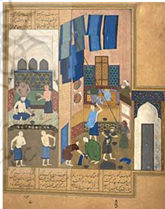
تصویر شماره ۳، هارون الرشید در حمام، نسخه‌ای از خمسه نظامی، اثر کمال الدین بهزاد، قرن ۱۵ میلادی، محل نگهداری کتابخانه ملی بریتانیا، مأخذ گرابار، ۱۳۹۶، ۱۵۵

در نتیجه رازهای با شکوهی ثبت شود که همه ما قادر به کشف و دوست‌داشتن آن باشیم (گرابار، ۱۳۹۶، ۱۹۱-۱۹۳). لیمن در مورد ترکیبات حاضر در آثار دوره تیموری، از این توصیف استفاده می‌کند، در این نقاشی‌ها عواطف و حتی حالت چهره‌های اشخاص به شکلی قراردادی بازمایی شده است، انگار که حضور احساسات و ماهیت‌گذاری، آن تعادل در جهان بصری نقاشی را بر هم می‌زند. او در کتابش به نقل از نویسنده کتاب نام من سُرخ می‌نویسد؛ «نقاشی‌ها معرفت نگاه خداست به جهان، نگاه ثابت خداوندی که فراتر از زمان و مکان است» (لیمن، ۱۳۹۵، ۲۵۳). وی، ترکیب‌بندی‌های قبل از دوره بهزاد را سبک قدیم معرفی می‌کند و آن را بریده از واقعیت محسوس و آرمانی معرفی می‌کند و بهزاد ۱۵ (تصویر. شماره ۳) را برای اولین بار در تاریخ نقاشی ایران، مبدع ترکیب‌بندی‌های جدید می‌داند. در آثار بهزاد،