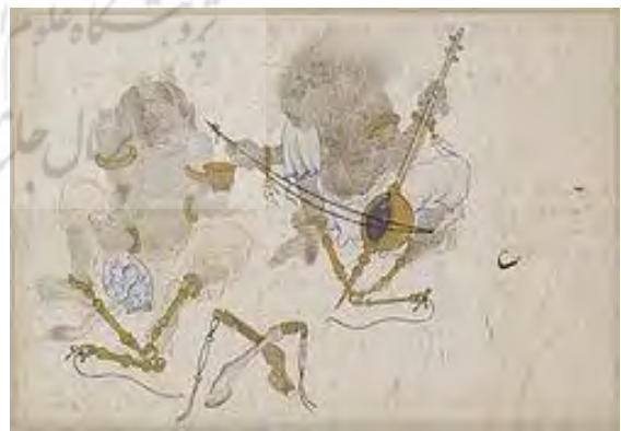
تصویر شماره ۴، دیوان خنیاگر، اثر محمد سیاه قلم، قرن ۱۵ میلادی، محل نگهداری موزه اسمیت سونیان، مأخذ گرابار، ۱۳۰۶، ۸۵

گرابار، در مورد موارد فنی و تأثیرات در فضای نقّاشی ایران می‌نویسد؛ «یقیناً در نقّاشی ایرانی، بسیار زیاد از عناصر نقّاشی چینی الهام گرفته شده‌است. بعنوان مثال می‌توان از اصولی که در نمایش منظره، درخت، گل و بعضی از جانوران یاد کرد (تصویر شماره ۴) که بسیاری از این اصول، از نقّاشی دورهٔ تانگ گرفته شده و قدمت آنها به چندین قرن پیش از ظهورشان در هنر ایرانی می‌رسد» (گرابار، ۱۳۹۶، ۱۶۲). وی در بیانات خود به این نکته تأکید دارد که عناصر فضا در دوره‌ها و مکاتب مختلف نقّاشی ایرانی تغییر و تحولاتی نیز داشته‌است. وی در این مورد ادّعا می‌کند که با برشمردن چند مثال ساده و به راحتی می‌توان ثابت کرد که «... طی نیمه دوم قرن پانزدهم میلادی، مضامین تازه‌ای که در زندگی روزمره کشف شد، مضامین عاشقانه و حماسی را تا حدودی به حوادث متناسب با زندگی واقعی تبدیل کرد و در بعضی مواقع می‌توان در این نقّاشی‌ها، تفسیری از جامعه