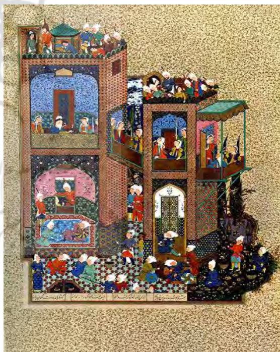
تصویر شماره ۱، کابوس ضحاک، شاهنامه شاه طهماسبی، اثر میر مصور، قرن شونزدهم میلادی، مجموعه خصوصی، مأخذ گرابار، ۱۳۹۶، ۹۸.

با تکیه بر اهمیت خیال که در اصل پرتو روح است مرتبط می‌داند؛ «...هر تجلی ابتدا در روح نقش می‌بندد و سپس از آن ساطع می‌شود و به همین علت است که اشکال در نقاشی ایرانی، همچون صور معلق جلوه‌گر می‌شوند و به قول سهروردی، در ناکجا آباد (هم مرکز و هم محیط) واقع شده و به این علت است که هر چیزی در آن شگفت‌انگیز است» (شایگان، ۱۳۹۷، ۷۳). بورکهارت ۶ در مورد وجود اسلیمی، یکی از نقوش کلیدی در ترکیبات نقاشی ایرانی می‌نویسد؛ «این فرم، در عین اینکه مانند آهنگ در اثر جلوه می‌کند، اشکارا پیوند اصلی خود را با گیاهان، نگه می‌دارد؛ با آنکه ظاهراً از طبیعت دور شده است ولی هنوز با غنا و فراوانی مرتبط است» (بورکهارت، ۱۳۶۵، ۷۲). در حقیقت وی به این تأکید دارد که با وجود تجریدی شدن فرم‌ها در نقاشی ایرانی، آنها حامل مفاهیمی هستند که در تشکیل فضای خاص در نقاشی این سرزمین، تأثیرگذار بوده‌اند. شایگان نیز در مورد نقوش گیاهی حاضر در هنر ایرانی، مانند اسلیمی، تفاسیری