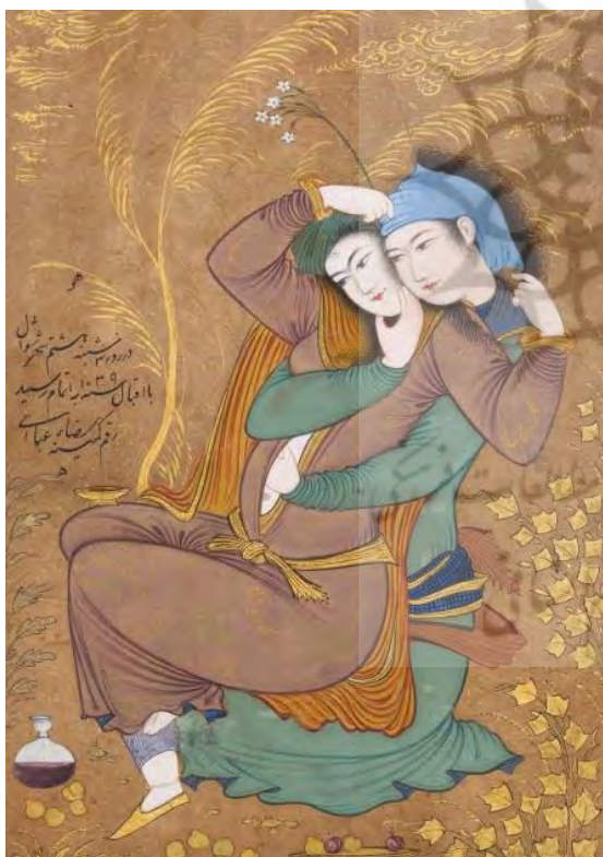
تصویر شماره ۷، دو عاشق، تک نگاره، اثر رضا عباسی، مکتب اصفهان، قرن ۱۷ میلادی، محل نگهداری موزه مترو پلینتن نیویورک، مأخذ ناظری و همکاران، ۱۳۹۷، ۷۵.

می‌کنند. انگار که در حالت یادآوری واقعه لذت‌بخشی از گذشته هستند. شاید هریک از این دو عاشق در حال یادآوری نخستین وعده ملاقاتشان هستند (کنبی به نقل از ناظری و همکاران، ۱۳۹۷، ۷۵). هم‌چنین به مثال‌هایی که تاریخی‌اندیشان در مورد تصاویر می‌گساری و یا شاهان و شاهزادگان مست و با بدن‌های برهنه مطرح می‌کنند، می‌توان اشاره کرد. از نظر تاریخی‌اندیشان در این موارد ابهامات بیشماری وجود دارد که نمی‌توان با یک حکم کلی فضای حاکم بر ترکیب‌بندی‌های نقاشی ایرانی را تعریف کرد. نکته قابل توجه این است که برخلاف نظر سنت‌گرایان که همواره هنر را به مسائل قدسی مرتبط می‌دانند؛ «... تاریخی‌اندیشان ولی با وجود استفاده از صفت اسلامی، هیچ اشاره‌ای بعضاً به چگونگی بازتاب ویژگی‌های اسلامی در آثار هنری (و از جمله نقاشی ایرانی) نمی‌کنند...» (رشیدی، ۱۳۹۶، ۱۳).