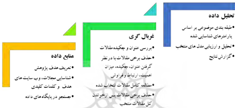
شکل ۲. فرایند انجام پژوهش

هدف از انجام پژوهش حاضر معرفی و ارزیابی مدل‌های آمادگی سازمان برای ورود به صنعت ۴.۰ است. روش پژوهش، مبتنی بر روش نظام‌مند مرور ادبی ۱ ترن فیلد ۲ و همکاران (۲۰۰۳) و سونی و نایل ۳ (۲۰۱۹) بوده که در شکل ۲ قابل مشاهده است.