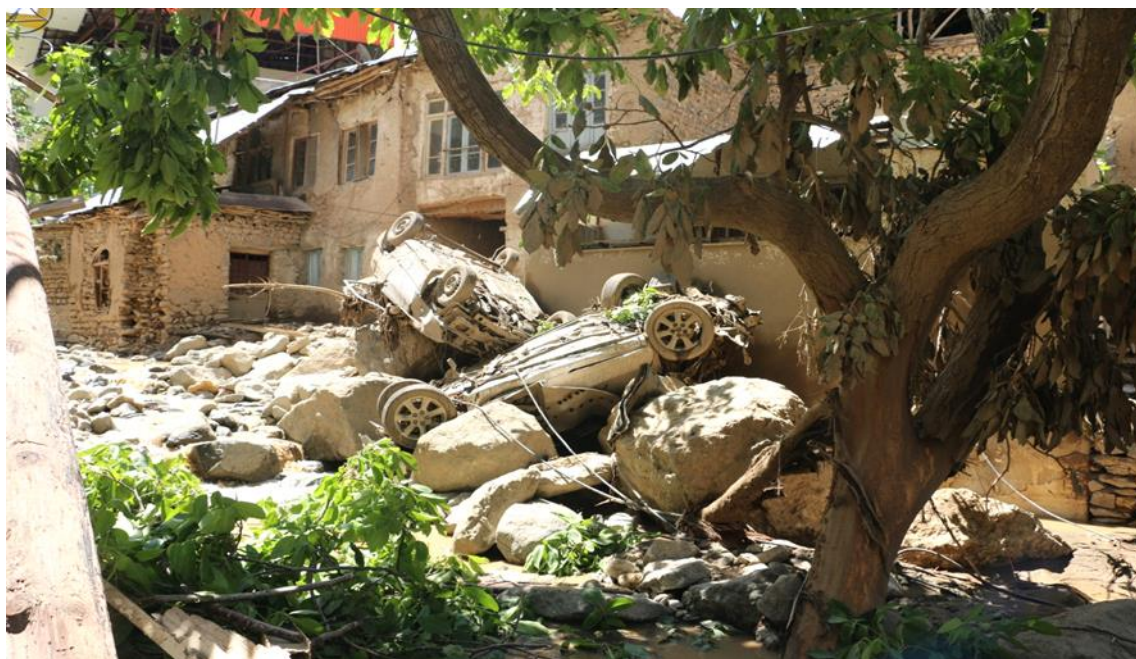
شکل ۴. نمائی از خسارت به منازل مسکونی و اتومبیلها در روستای سیجان، منبع: اداره کل منابع طبیعی و آبخیزداری، ۱۳۹۴ جدول ۱. میزان خسارت وارد شده به تاسیسات روستای سیجان در سیل ۱۳۹۴ (ارقام به میلیون ریال)