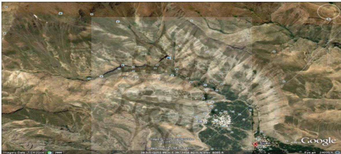
شکل ۲. محدوده وقوع سیل در روستای سیجان

الف: تلفات انسانی به تعداد ۸ نفر که اجساد آنها شناسایی گردیده و زخمی و مجروح شدن بیش از ۱۲۰ نفر در سطح روستا؛ ب: خسارت عمده به خودروهای موجود در مسیر سیلاب که حدود ۱۰۲ دستگاه خودرو در جریان این سیل گرفتار و بطور کامل متلاشی گردیده اند و برخی خودروها تا مسافتهای چند کیلومتری توسط سیلاب حمل شده اند. پ: خسارت عمده به خطوط انتقال برق و آب در داخل روستا و قطع آب و برق؛ ت: خسارت عمده به راه دسترسی و معابر داخل روستا و ورود سیلاب به داخل منازل و بروز مشکلات؛