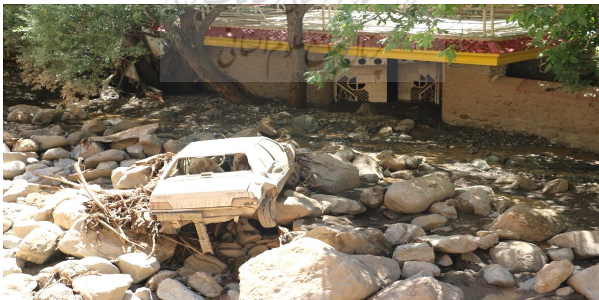
شکل ۳. نمایی از تخریب منازل مسکونی و اتومبیل در سیل سیجان