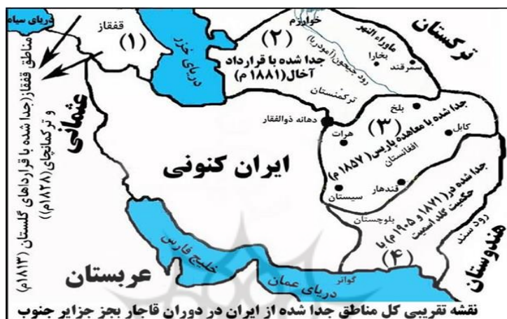
شکل (۲). تغییرات جغرافیایی در مرزهای شمال و شمال شرق بعد از قرارداد آخال، گلستان و ترکمنچای

۹۰-۹۱). روس‌ها در ابتدا نواحی شمال غربی ایران را تصرف نمودند و از ضعف ساختاری ارتش ایران و عقب‌ماندگی آن نهایت استفاده را برده و طی دو قرارداد گلستان ۱۱۹۲ ش برابر با ۱۸۱۳ میلادی و ترکمن‌چای ۱۲۰۷/م ۱۸۲۸ ش موفق به تصرف نواحی گسترده‌ای از ایران شدند و عملاً تغییرات جغرافیایی در مرزها و ژئوپلیتیک شمال ایران به وجود آمد. این تغییرات در شکل (۲) نشان داده شده است.